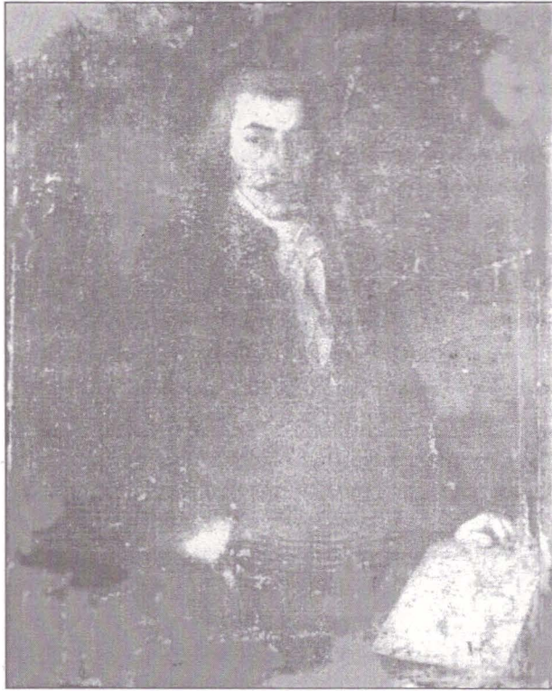
Fig. 1. (Ștefan) Istvan Bosnyak-Franz Anton Bergman, 1797