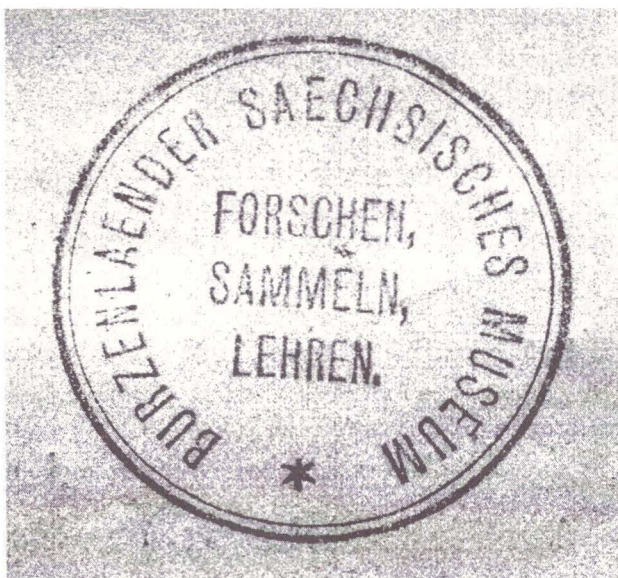
1. Emblema Muzeului Săsesc al Țării Bârsei, cu devisa “Erforschen – Sammeln – Lehren” (Să cercetăm – Să colecționăm – Să învățăm).

Privit din perspectivă contemporană, Muzeul Săsesc al Țării Bârsei se dovedește a fi un muzeu cu o concepție nu departe de definiția actuală a muzeului dată de ICOM: „Muzeul este o instituție cultural – științifică având ca obiectiv colectarea și conservarea bunurilor de cultură și valorificarea lor prin expunere în scop de instruire și agrement a publicului”. Finalitatea sa generală era, ca și a muzeelor de astăzi, educațională, iar prin activitatea sa, el a concretizat ceea ce astăzi numim „funcțiile muzeului”: cercetare, constituire și dezvoltare a patrimoniului, conservare – restaurare și valorificare cultural – educativă a patrimoniului. Concepția sa era modernă, era concepția epocii. Ea este încă actuală. Suntem încă tributari secolului al XIX-lea ?