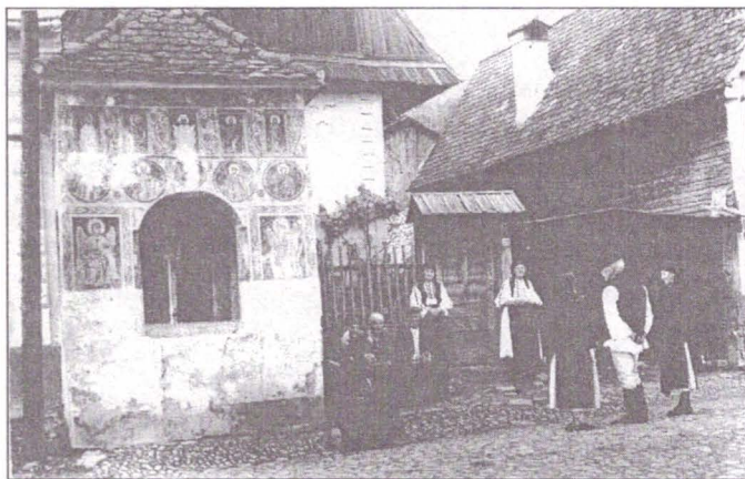
2 – Troiță-capelă, de răscruce, de secol XIX, distrusă în 1963, existentă doar în colecții de fotografie veche – sat Galeș, jud. Sibiu