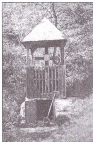
1 – Troiță de izvor, sat Rod, com. Tilișca, jud. Sibiu

Am ajuns la această formulă deoarece celelalte încercări de tipologie nu ne-au acoperit complexitatea datelor din teren. Din diferite motive unele monumente au fost deplasate din locul original creându-se astfel dificultăți în încadrarea lor tipologică. Dacă se înțelege semnificația acestor monumente o cercetare atentă în teren va rezolva problema. Suntem de asemenea conștienți că, în condițiile actuale, un repertoriu va conține o serie de monumente fără valoare estetică, acestea fiind majoritare în unele localități, însă este necesar să o facem deoarece înțelegerea a ceea ce reprezintă troița în viața comunității rurale și ce valoare au aceste monumente de arhitectură populară de sec. XVIII, XIX, și început de sec. XX poate duce nu numai la păstrarea lor dar, eventual și la o orientare estetică pozitivă în vederea continuării tradiției și la eliminarea în timp a tendințelor spre kitch.