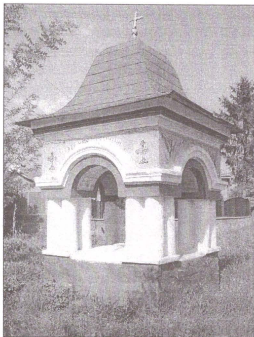
4 - 5 – Troițe-capelă restaurate fără modificări – Rod și Săliște jud. Sibiu