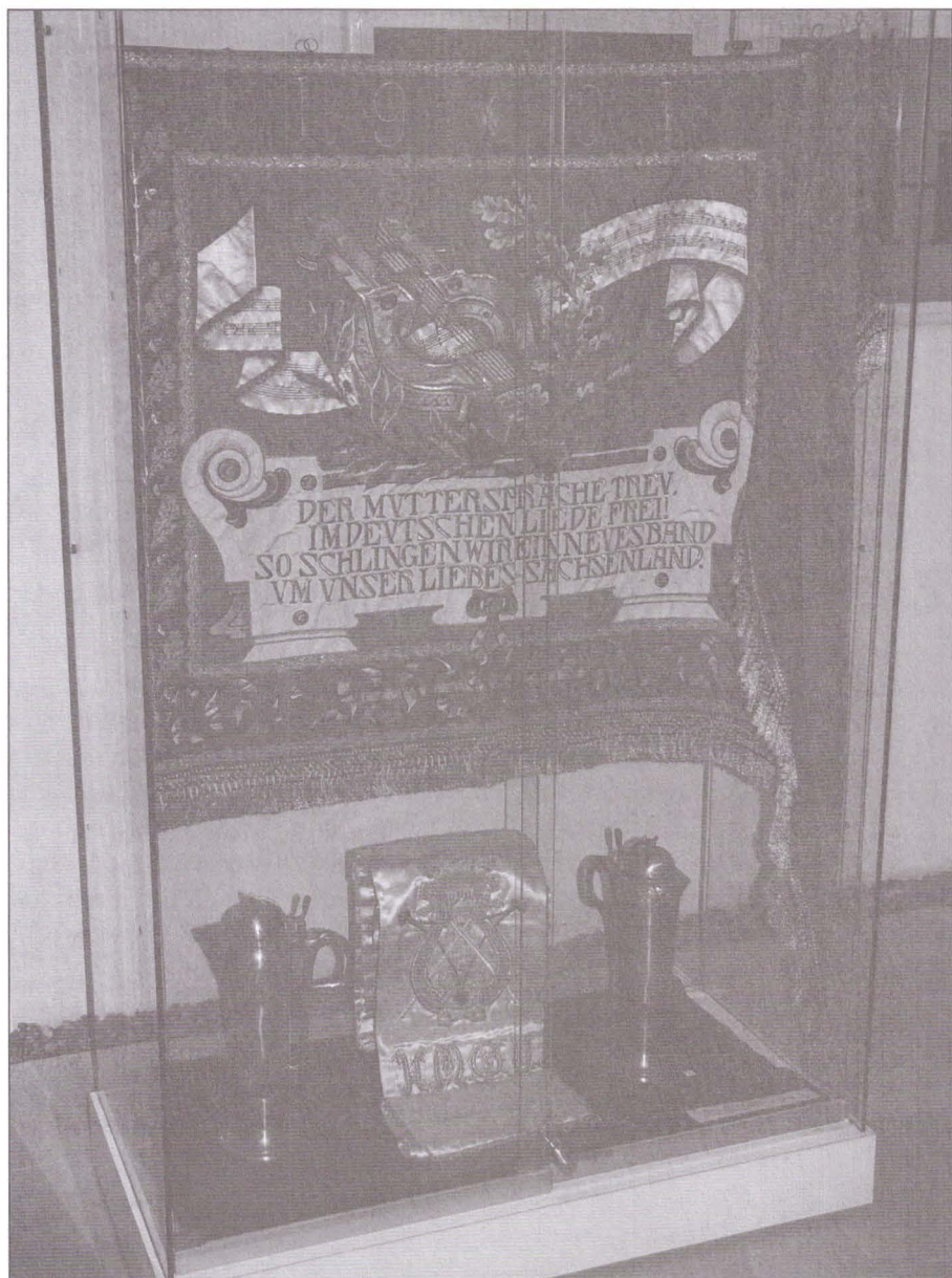
7. Expoziția „Sibiu, oraș al muzicii”