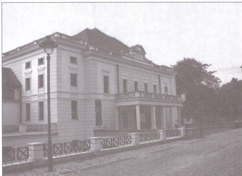
4. Expoziția „Din istoria teatrului sibian”