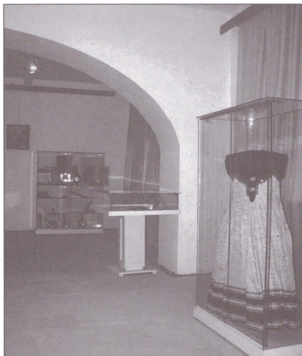
2. Expoziția „Sibiu, oraş european”