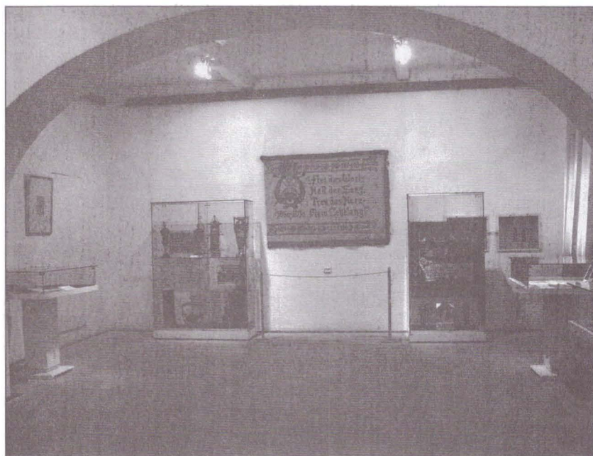
6. Expoziția „Sibiu, oraș al muzicii”