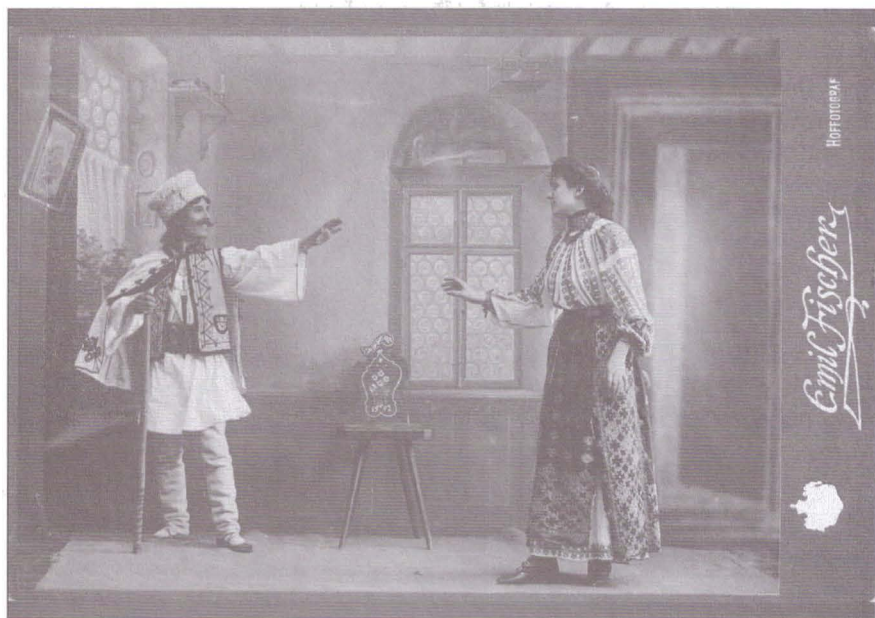
8. Expoziția „Sibiul văzut de fotografi”