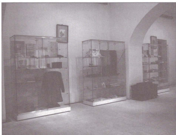
1. Expoziția „Sibiu, oraş european”