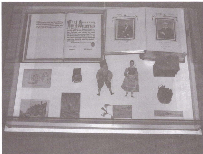
3. Expoziția „Samuel von Brukenthal homo europaeus -190 de ani de la deschiderea oficială a Muzeului Brukenthal”