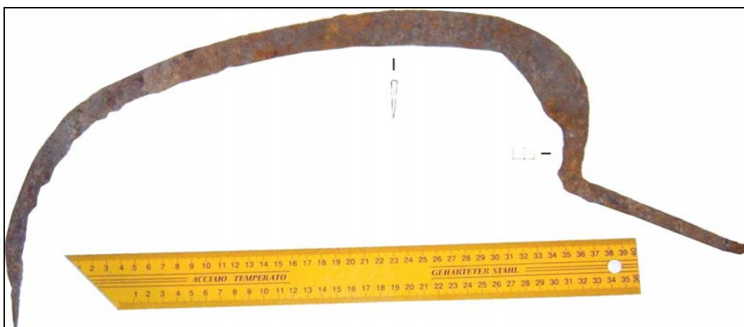
Fig. 1. Seceră de fier descoperită la Radovan, județul Dolj