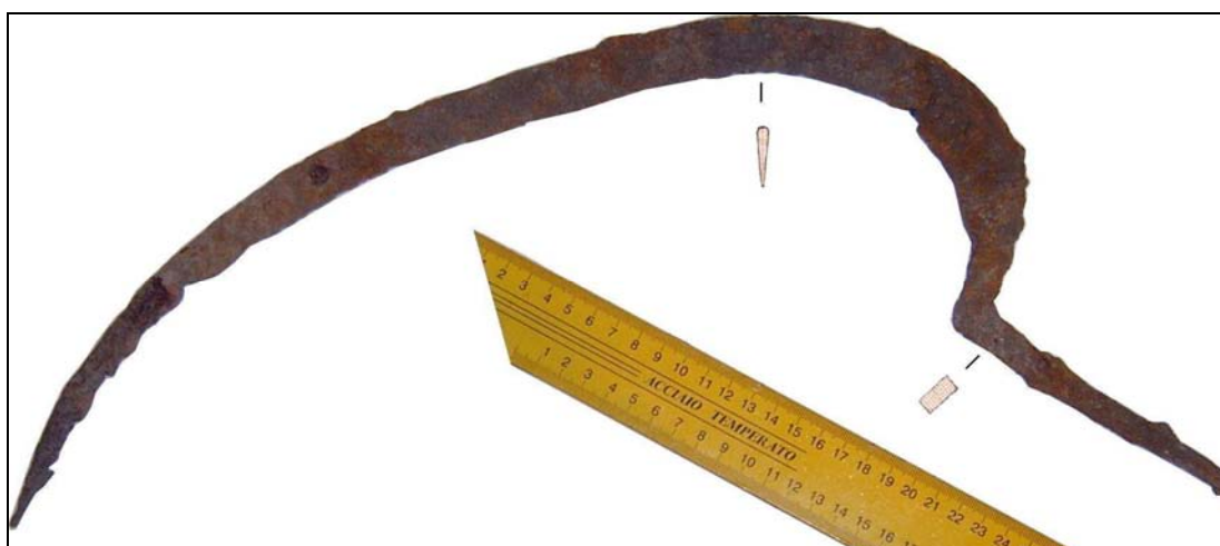
Fig. 2. A doua seceră descoperită la Radovan, județul Dolj