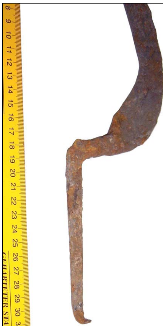
Fig. 1b. Alt detaliu al aceleiași piese