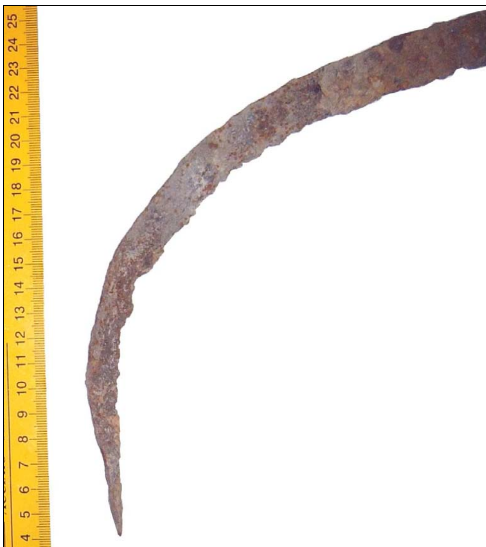
Fig. 1a. Detaliu al secerii menționată mai sus