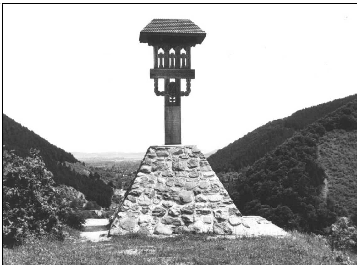
Galeș, Troița închinată eroilor , de pe Gherghelău