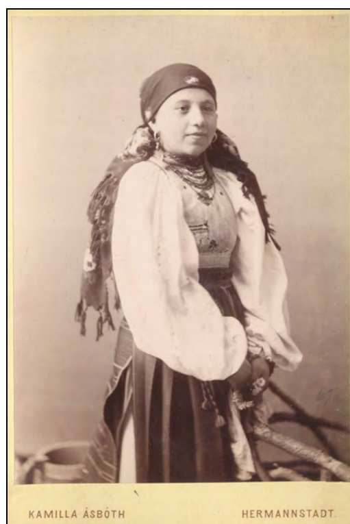
Fig. 2. Femeie în costum popular românesc din Mărginimea Sibiului