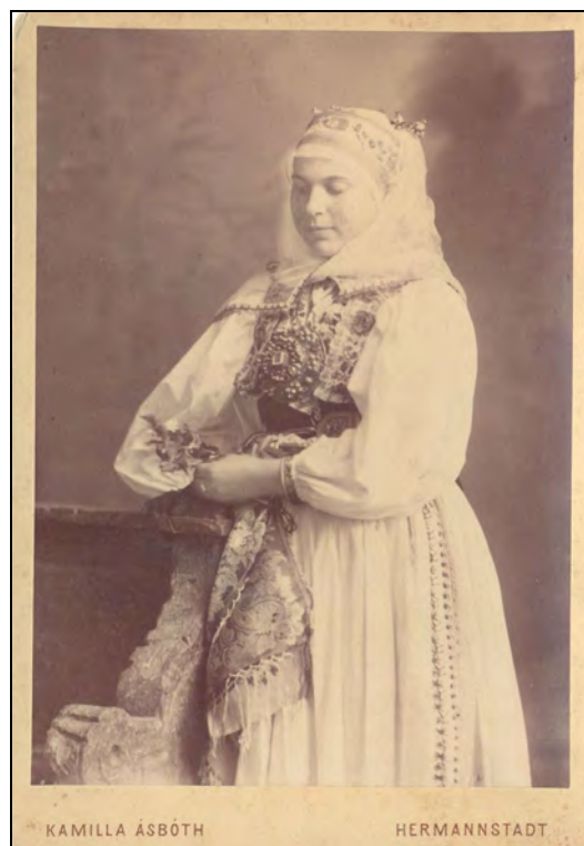
Fig. 4. Femeie în costum săsesc din zona Sibiu