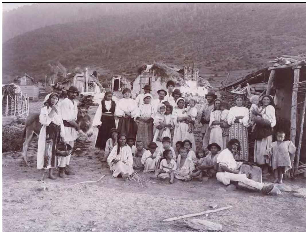
Fig. 6. Țigani din Prislop, județul Sibiu