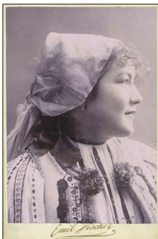
Fig. 1. Femeie în costum popular românesc din Săliște, județul Sibiu