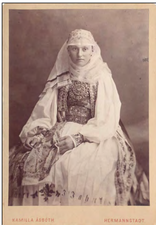
Fig. 3. Femeie în costum săsesc din zona Sibiu