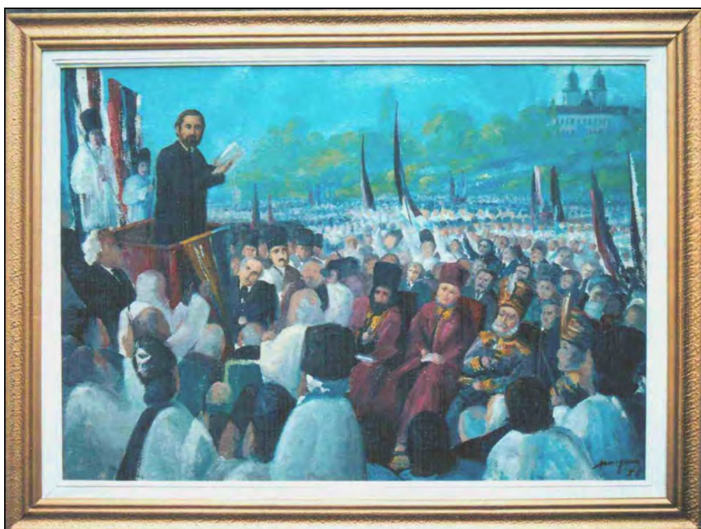
Fig. 6. I. Moga, Marea Adunare Națională de pe Câmpul Libertății de la Blaj din 3/15 mai 1848, 1958