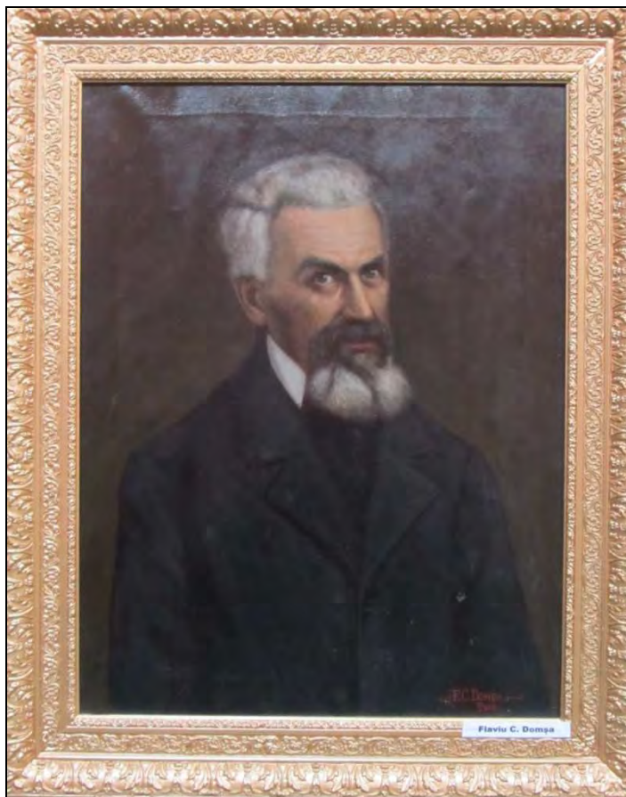
Fig. 2. F. C. Domșa, Timotei Cipariu , 1905