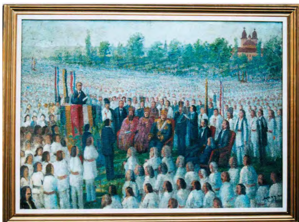
Fig. 7. I. Moga, Marea Adunare Națională de pe Câmpul Libertății de la Blaj din 3/15 mai 1848