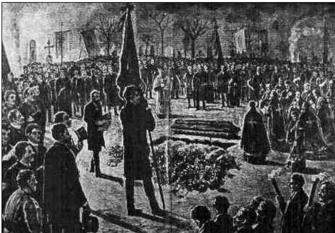
Fig. 4. A. Zeiler, Funeraliile lui Augustin Bunea , 1909/10