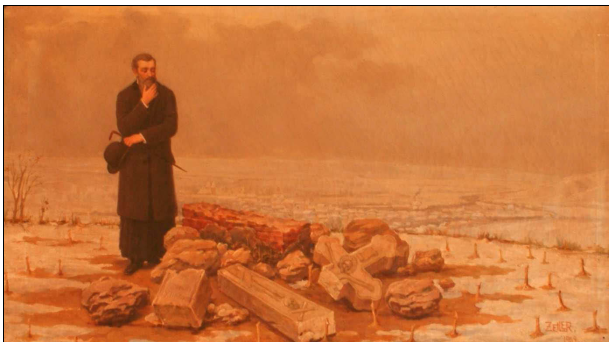
Fig. 3. A. Zeiler, Din suferințele noastre , 1909