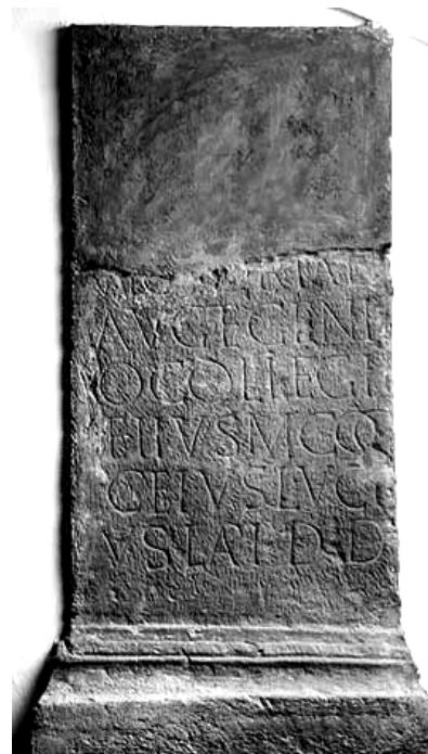
Fig. 5. Foto: O. Harl, 2004