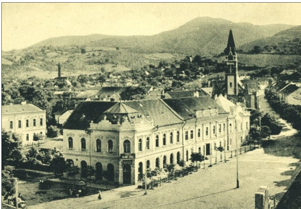
Fig. 3. Edificiul în care a Funcționat Casina română din 1868 până la desființarea de către regimul comunist