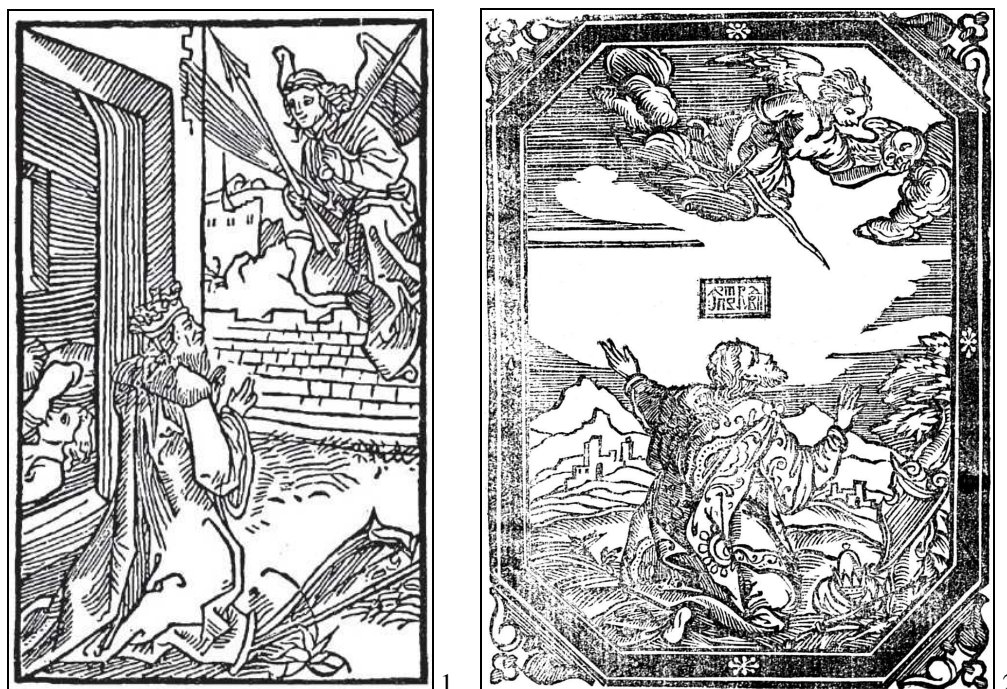
Fig. 1. 1. Albrecht Dürer, David , 1499; 2. David , Psaltire slavo-română , Iași, 1680

despre care se spune că a avut „ca punct de plecare” pe aceea din Psalmi Davidis, Lugundi, ex officia luntarum 18 .