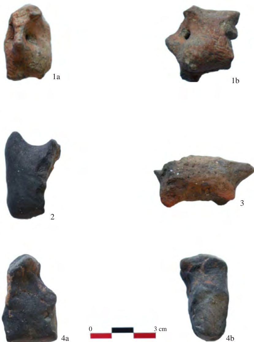
Fig. 3. 1. Figurină zoomorfă (Brănișca – Dâmburi/Pe Hotar ); 2. Protomă zoomorfă; 3. Figurină zoomorfă; 4. Figurină antropomorfă (Orăștie – Dealul Pemilor X2/Rompoș )

antropomorfă și zoomorfă neolitică și eneolitică din Transilvania 16 . Aceste tipuri de piese sunt elemente distinctive care reprezintă o importantă sursă de informații pentru reconstituirea diferitelor aspecte ale comunităților din perioada neolitică și eneolitică 17 .