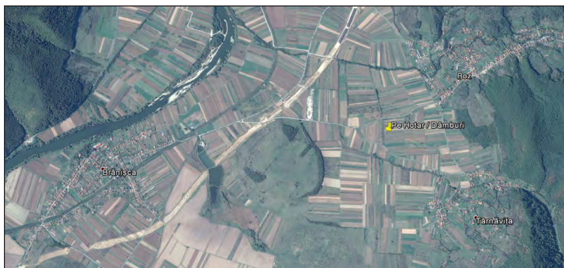
Fig. 1. Localizarea geografică a punctului de la Brănișca – Dâmburi/Pe Hotar (jud. Hunedoara) (prelucrare după Google earth) (Accesat: 12.05.2017)