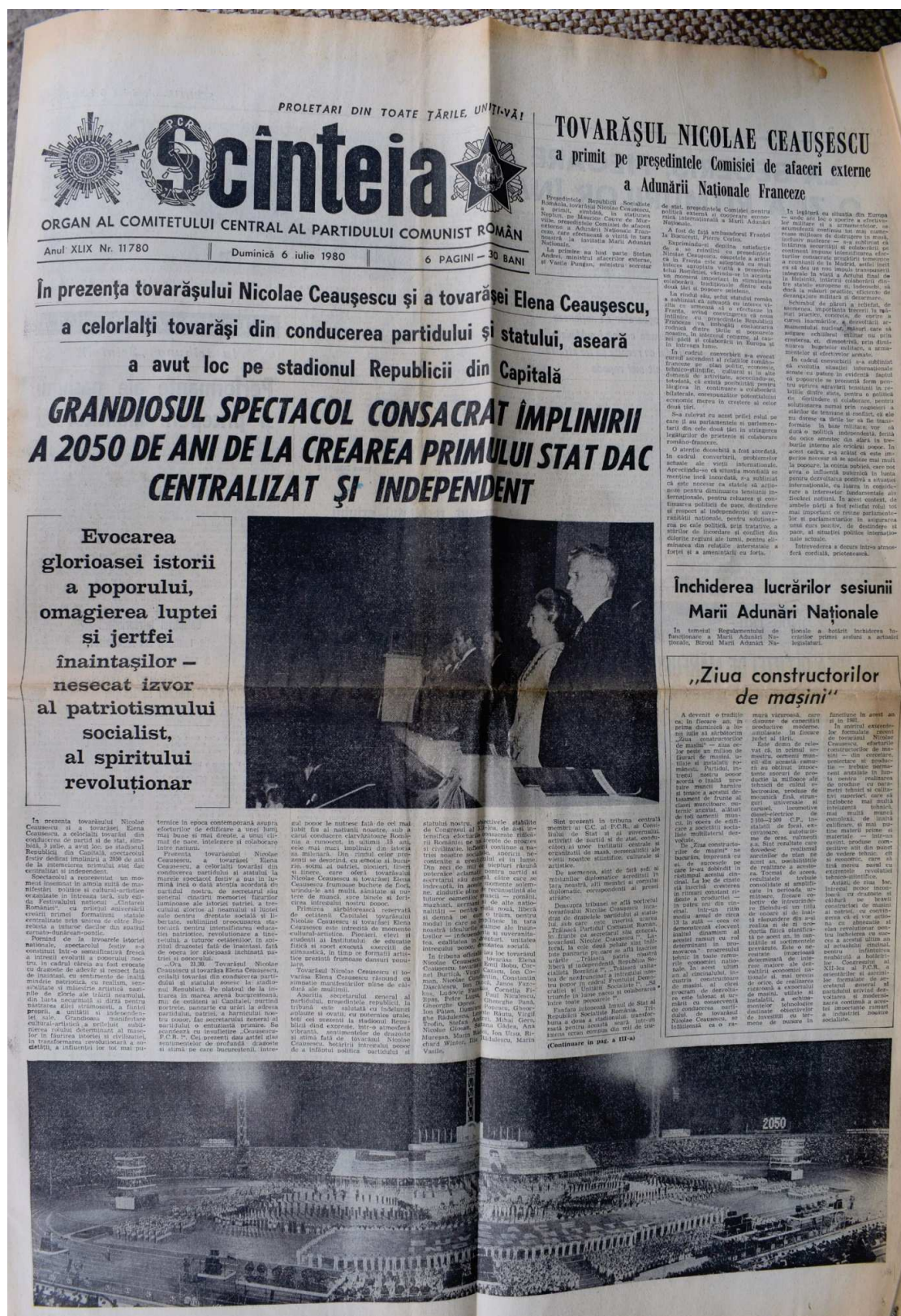
Pl. II. Prima pagină a ziarului Scînteia din data de 6 iulie 1980