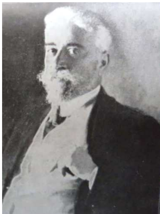
Fig. 1. Ion I. C. Brătianu (1864-1927)

La sfârșitul lunii noiembrie 1918, Iuliu Maniu trimitea Ministerului francez al Afacerilor Externe un memoriu în care arăta prejudiciile aduse românilor din Transilvania prin Convenția de la Belgrad care „împarte națiunea română din Transilvania și Ungaria în două părți, ceea ce agravează dificultățile în acțiunea de renaștere națională și în organizarea ei, atât de necesară în aceste zile de prefaceri istorice” 4 . Iuliu Maniu cerea guvernului francez ca puterile aliate să considere, ca și în cazul cehoslovacilor și iugoslavilor, națiunea română din Transilvania ca o națiune aliată. El mai solicita modificarea liniei de demarcație și delimitarea teritoriilor ce puteau fi ocupate de armata română.