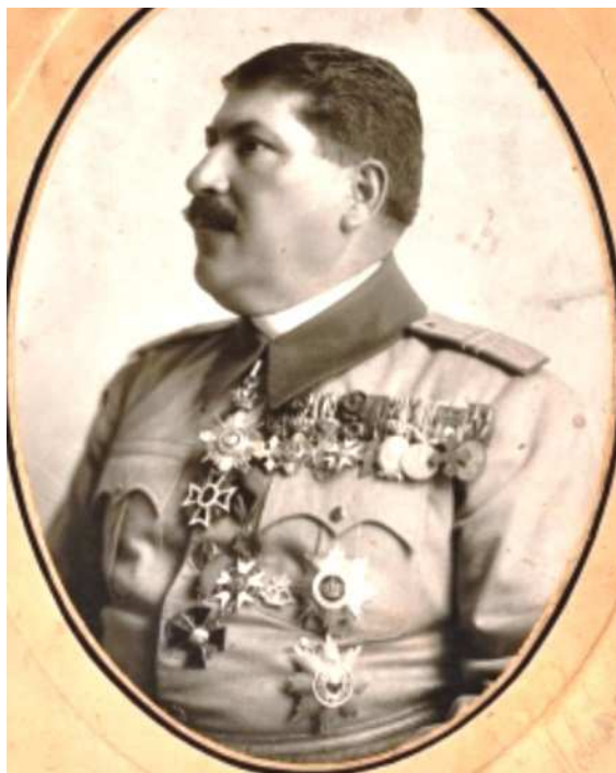
Fig. 2. Traian Moșoiu, general de divizie