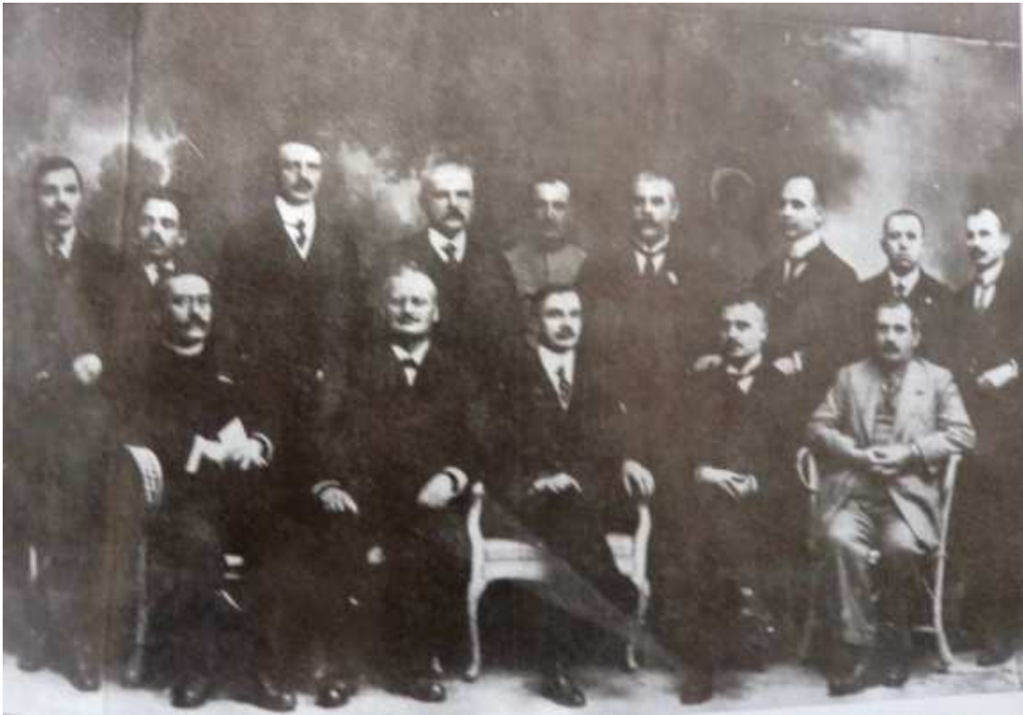
Fig. 3. Membrii Consiliului Dirigent al Transilvaniei

Iuliu Maniu, Președintele Consiliului Dirigent 31 .