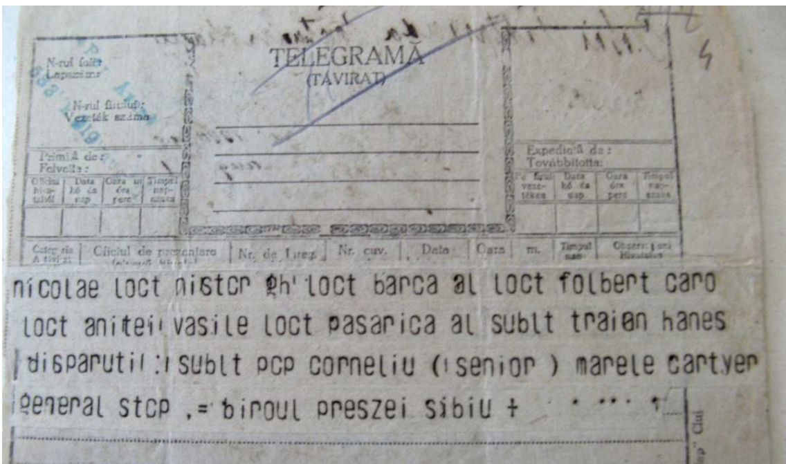
Fig. 7. Telegrama primită de prefectul Toma Vasinca din partea Consiliului Dirigent