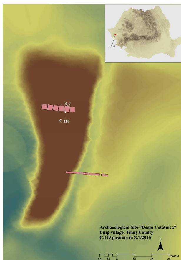
Fig. 1. Planul sitului arheologic Unip – Dealul Cetățuica