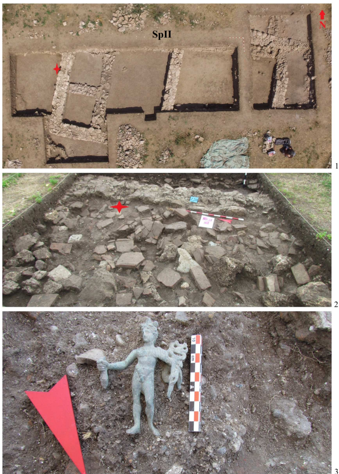
Pl. II. 1. Vedere aeriană a suprafeței de cercetare SpII împreună cu locul de amplasare al statuetei; 2. Contextul descoperirii statuetei din bronz, reprezentându-l pe Mercur, în vecinătatea zidului de est al clădirii centrale; 3. Contextul descoperirii, detaliu