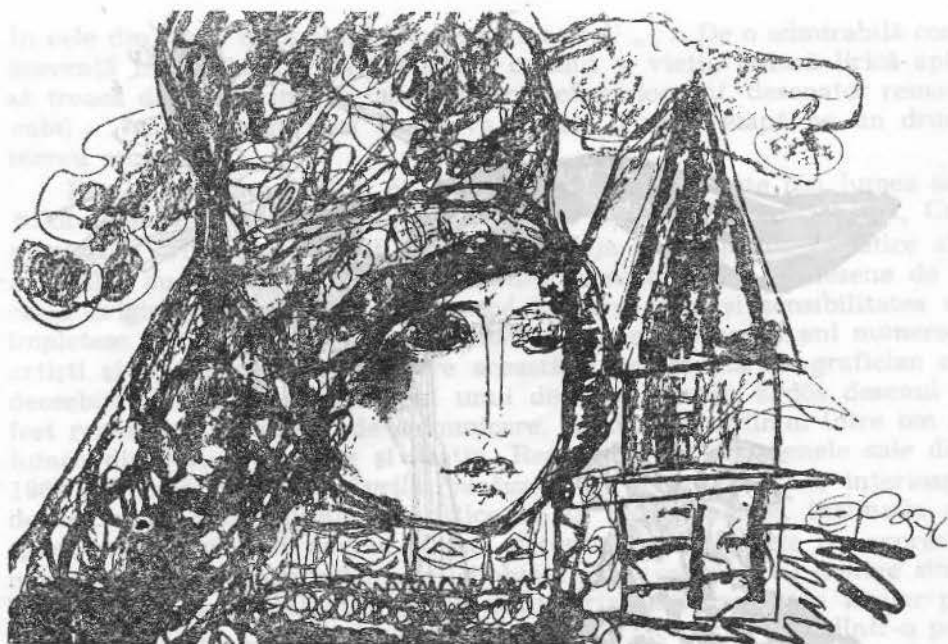
Fig. 10. Oaş (1976).