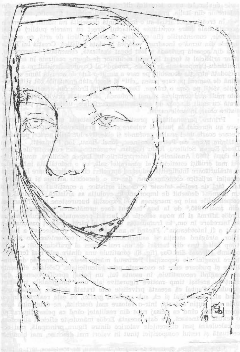
Fig. 6. Țărană din Lăpuș (1960).