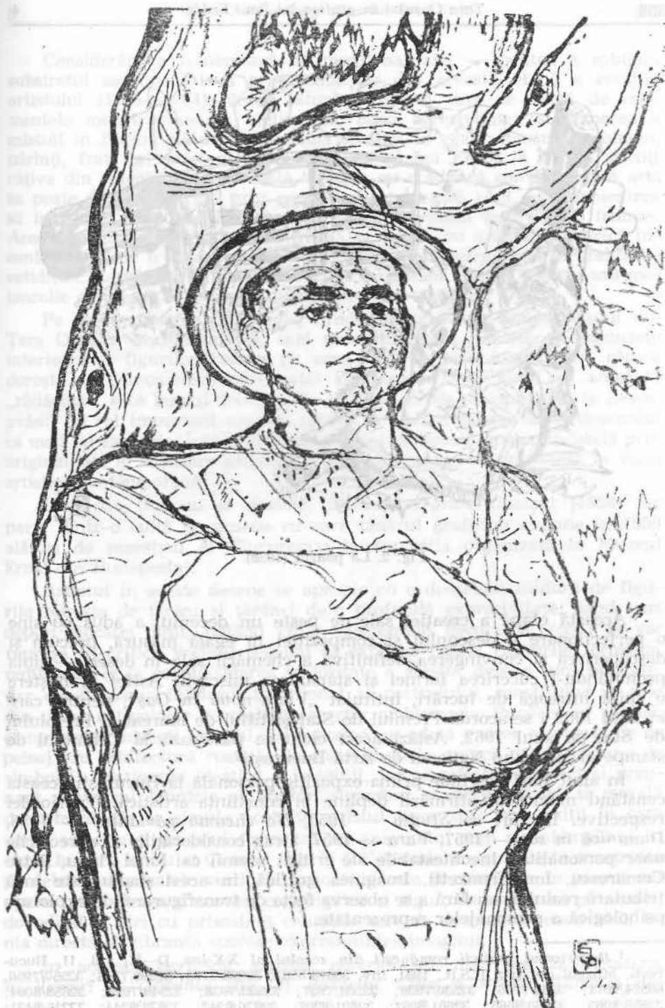
Fig. 3. Gorunul (1958).