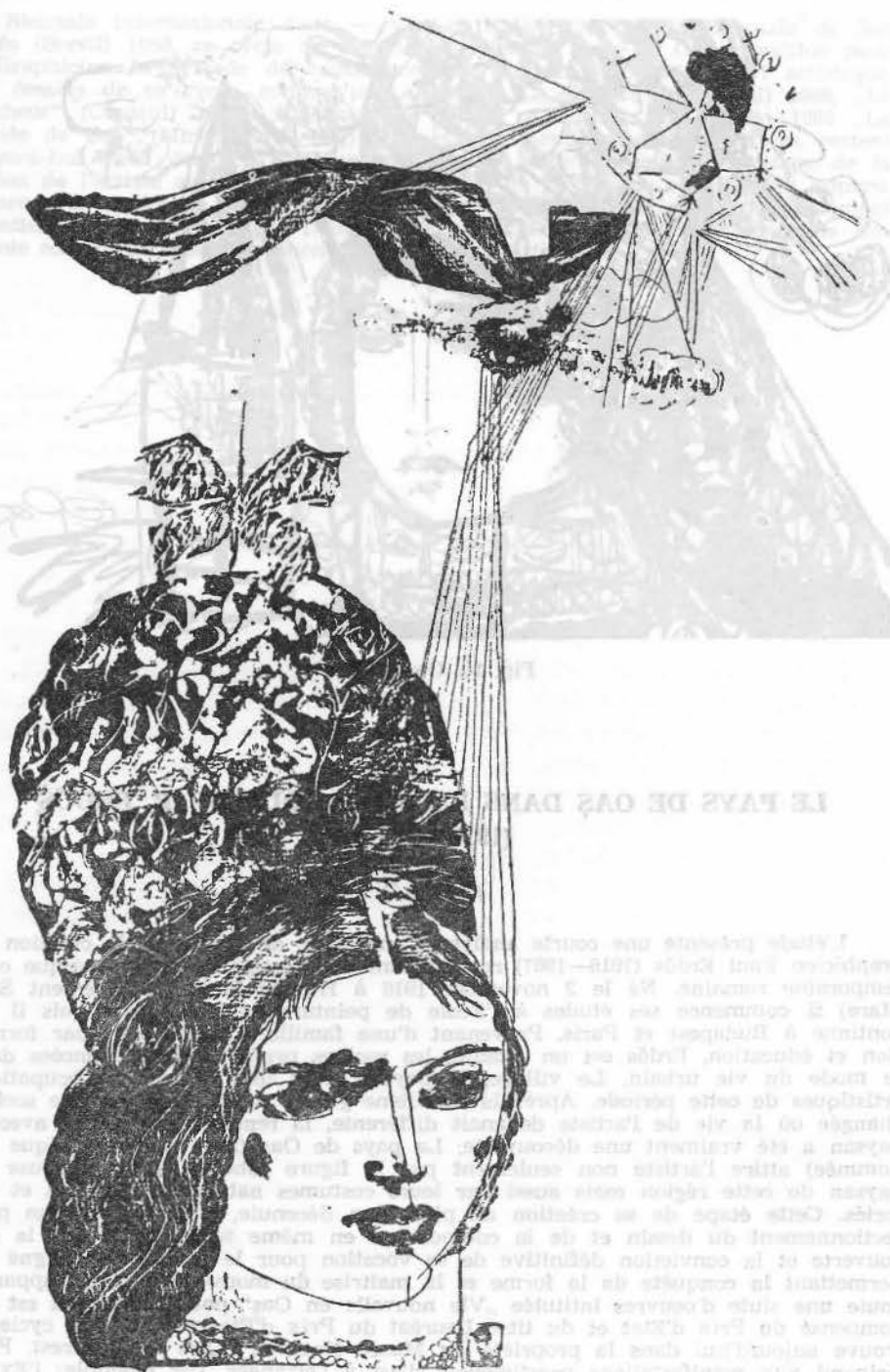
Fig. 9. Aprilie jucăuș (1964).