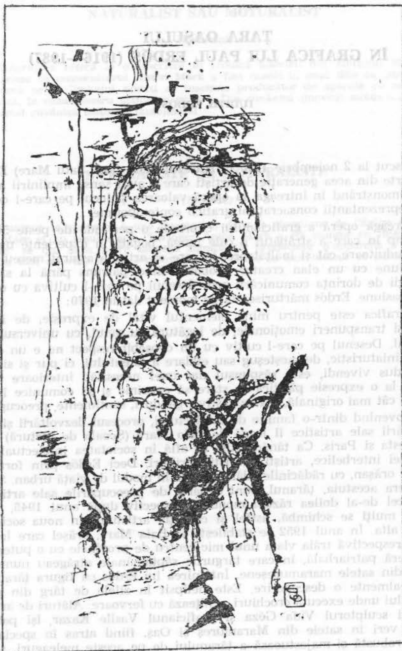
Fig. 1. Oameni și destine (1958).