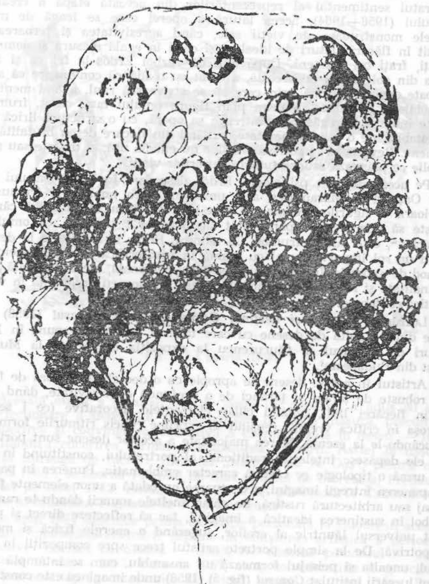
Fig. 4. Tăran (1958).