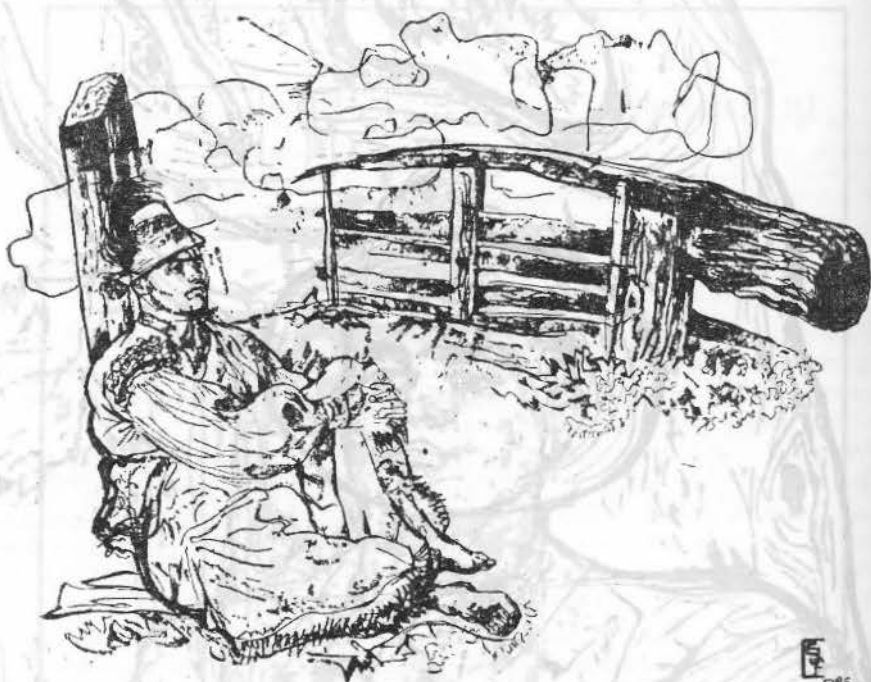
Fig. 2. La poartă (1958).

Această etapă a creației sale de peste un deceniu, a adus cu sine o perfecționare a desenului și compoziției în egală măsură, precum și descoperirea și convingerea definitivă a chemării sale în desen — linia promițându-i cucerirea formei și stăpânirea mișcării. Astfel ia naștere o suită întreagă de lucrări, intitulat „Viața nouă în Oaș”, pentru care în anul 1963 i se acordă Premiul de Stat și titlul de laureat al Premiului de Stat pe anul 1962. Astăzi acest ciclu se păstrează la Cabinetul de stampe al Muzeului Național de Artă București 1 .