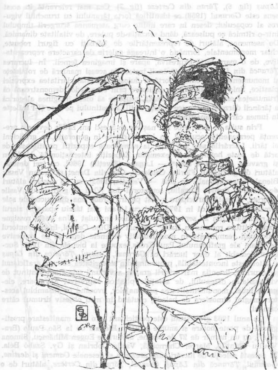
Fig. 5. Cosaşul (1958).