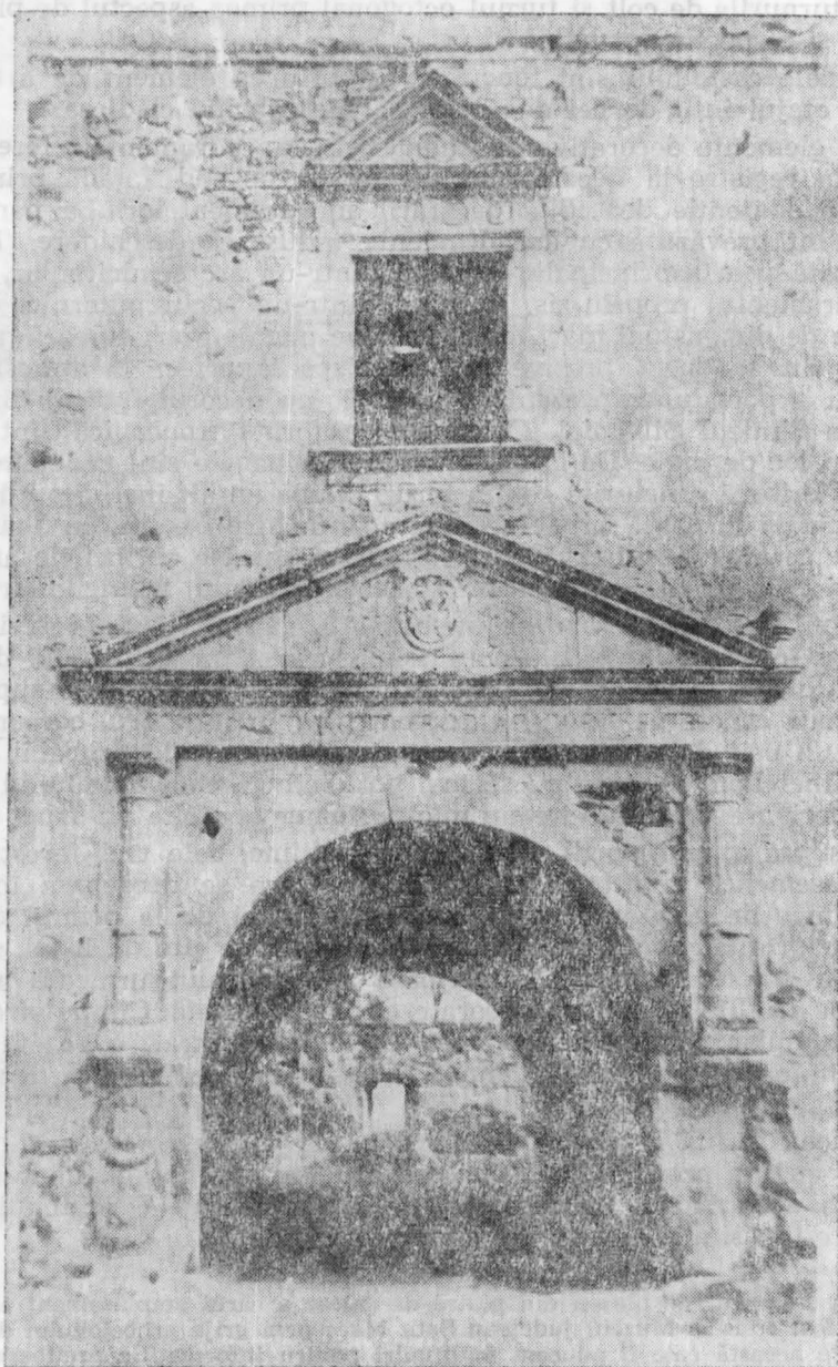
Fig. 1. Portalul cu inscripție.