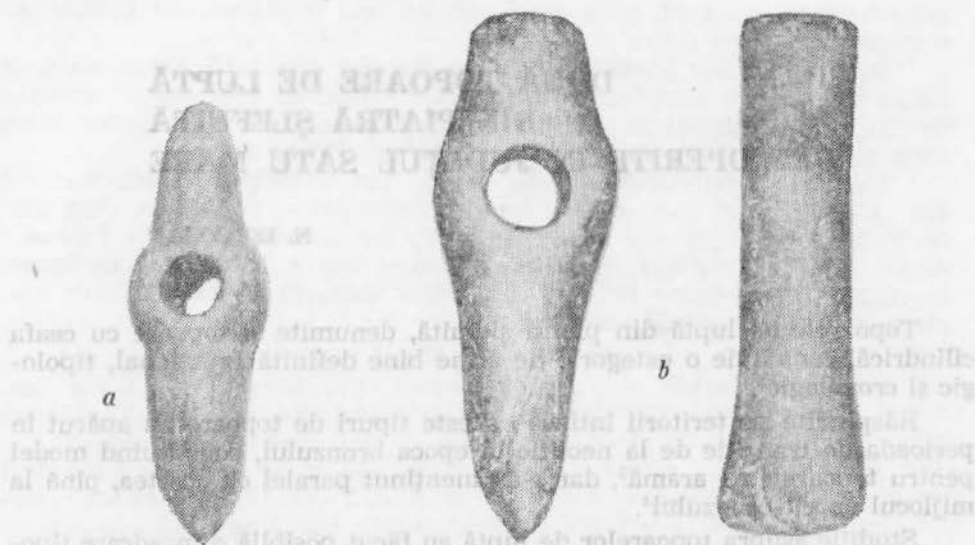
Fig. 1. Topoare de luptă descoperite la Dumbrava (a) și Blaja (b).

longitudinal drept. Brațul spre muchie este mai scurt și are formă cilindrică, muchia fiind rotundă, cu suprafața netedă. Poziția orificiului este mai aproape de muchie. Taișul este drept, simetric și lătit spre vîrf, moderat arcuit și bine ascuțit. Prezintă evidente urme de folosire, din vechime, reliefate pronunțat pe suprafața piesei prin două zgîrieturi: una de formă arcuită, pe o față laterală a taișului și una oblică față de axul longitudinal, pe partea din față a taișului toporului.