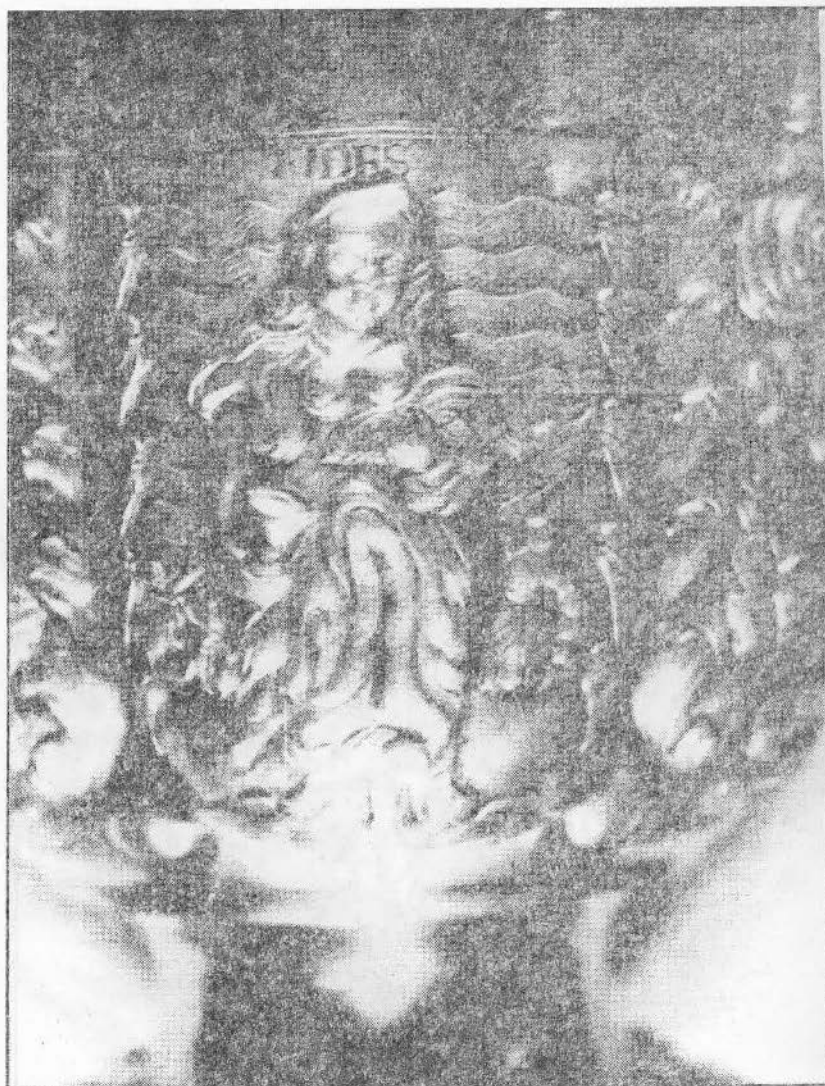
3.c. Virtuțile creștine: Fides (Credința)