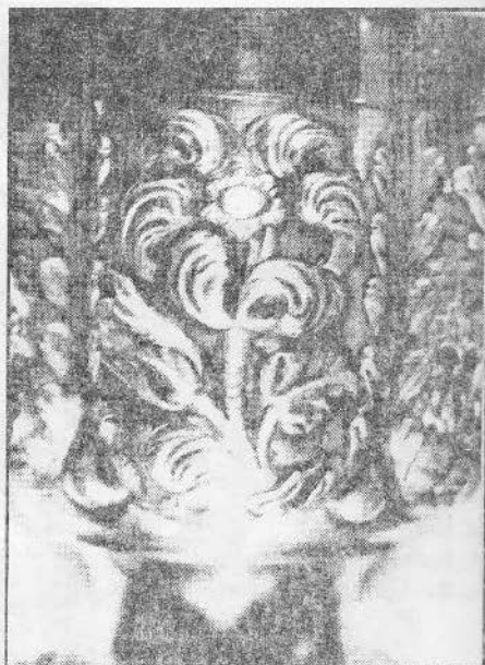
5. Florile simbolice creștine