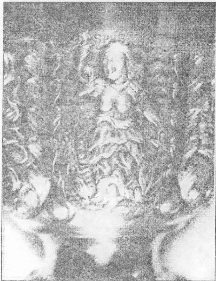
3.b. Virtuțile creștine: Spes (Speranța)