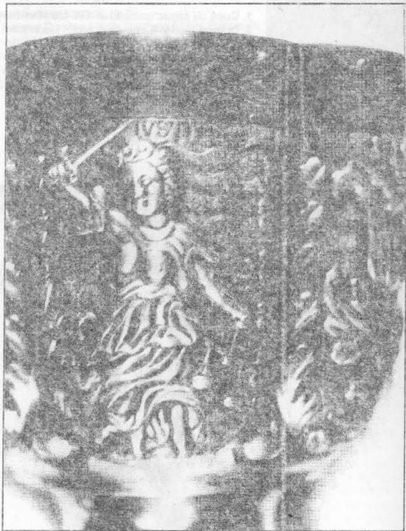
3.a. Virtuțile creștine: Justiția (dreptatea)