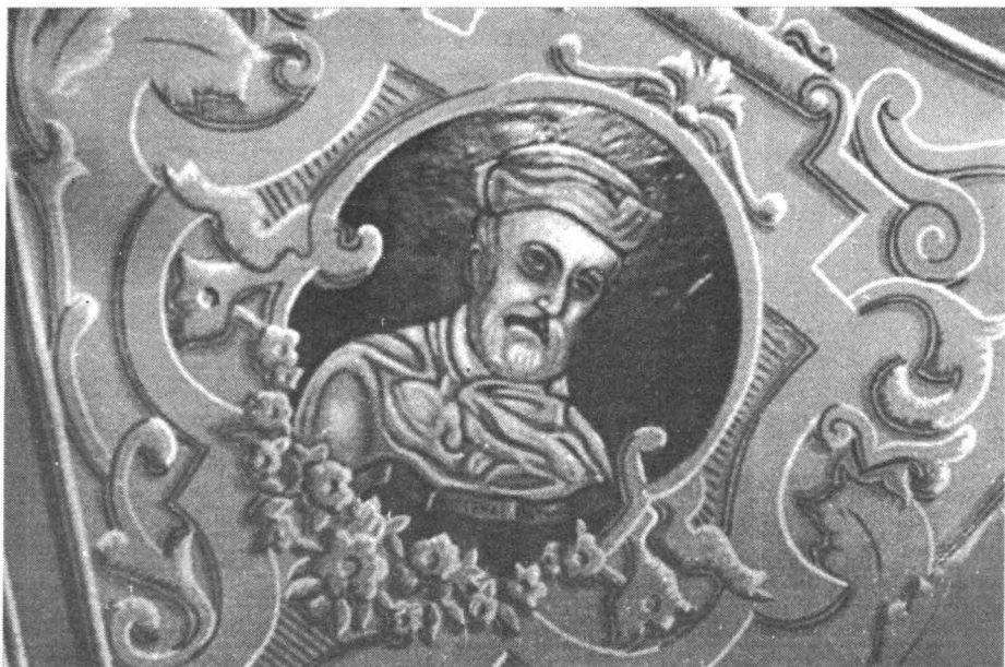
Fig. 1. Bartók Lajos – Bocskai István