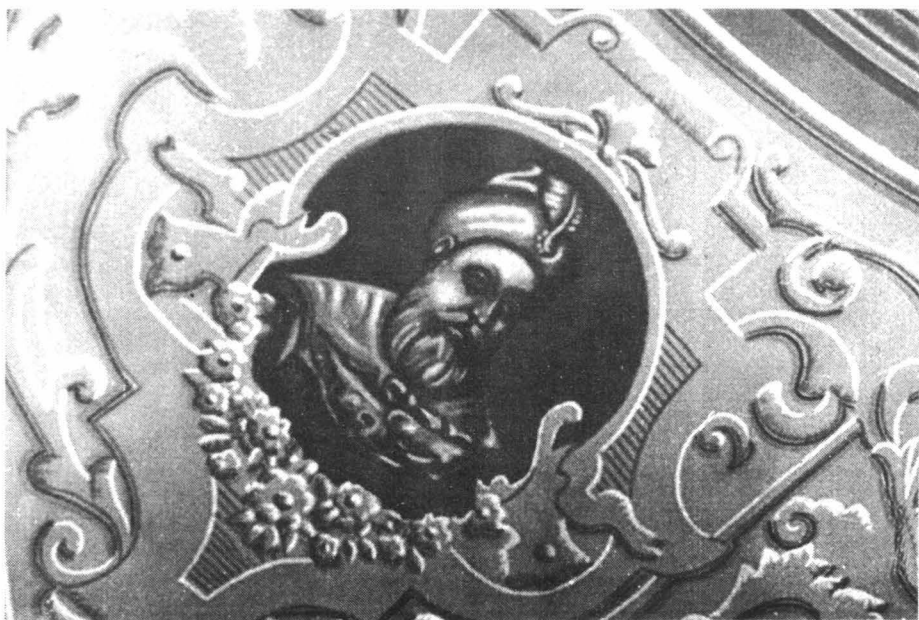
Fig. 2. Bartók Lajos – Bethlen Gábor