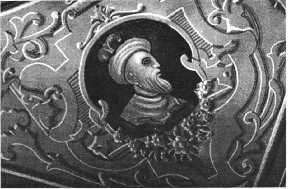
Fig. 3. Bartók Lajos – Gheorghe Rákoczi I