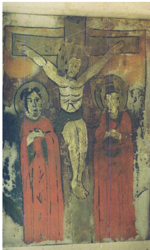
Înainte de restaurare - spate