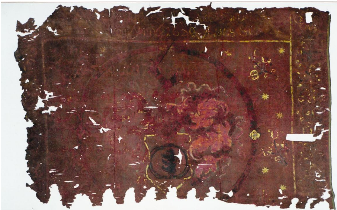
În timpul restaurării