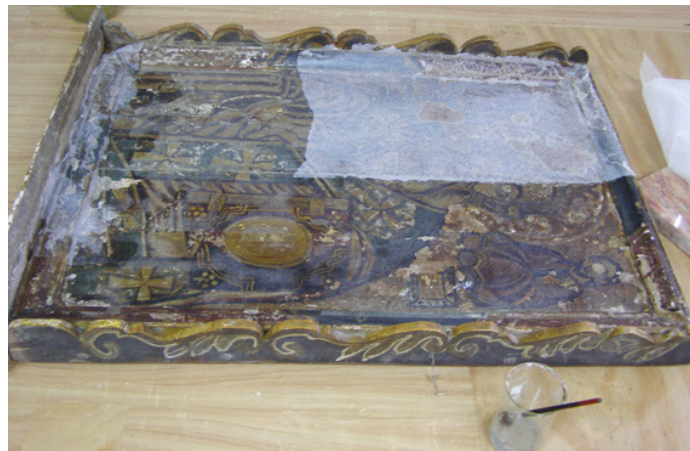
foto. 3- Consolidarea cu clei de peste și foita japoneza