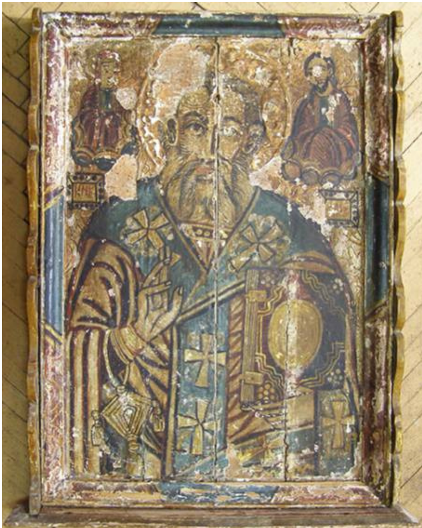
foto 2. -icoana Sf. Nicolae-