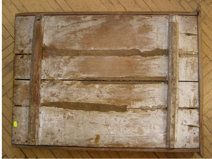
- verso-ul icoanei-