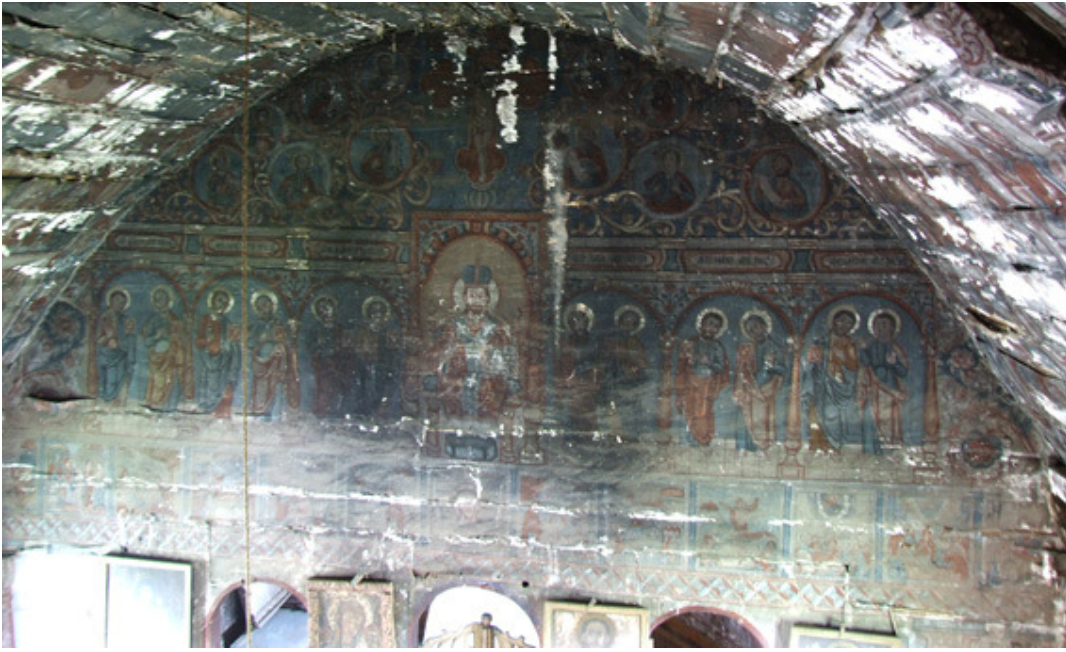
foto1. - fotografie făcută de sus spre iconostasul bisericii-