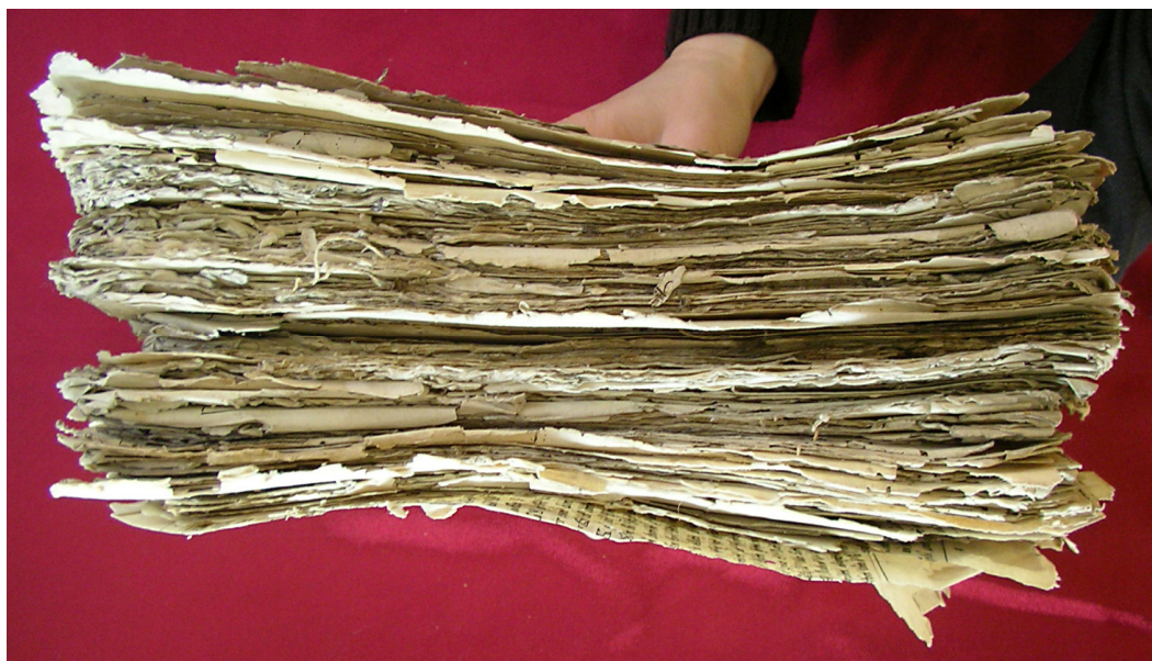
Chiriacodromion. Ansamblu înainte de restaurare