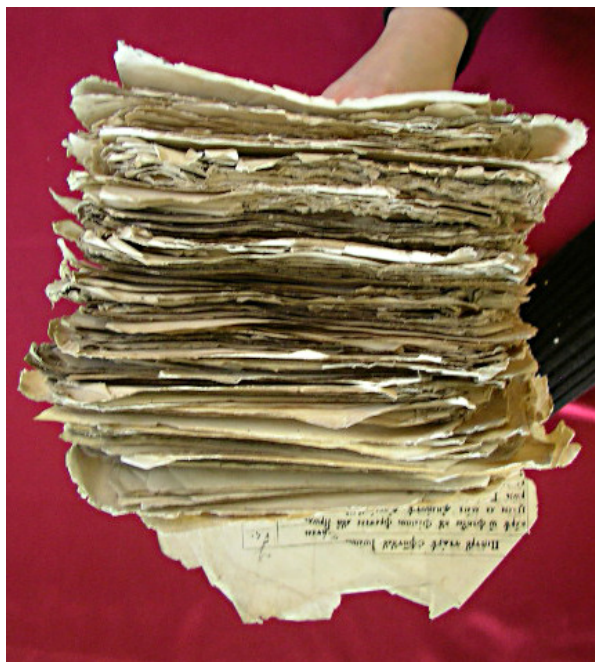
Chiriacodromion. Ansamblu înainte de restaurare