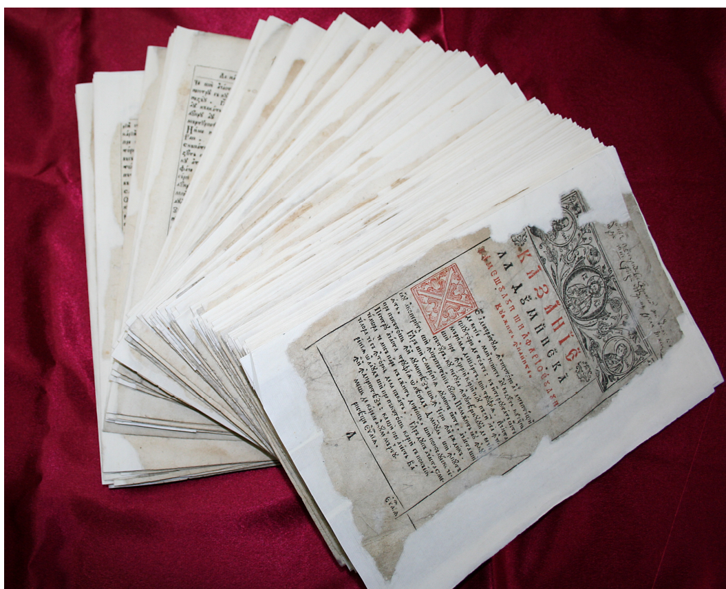
Chiriadromion. Ansamblu după restaurare