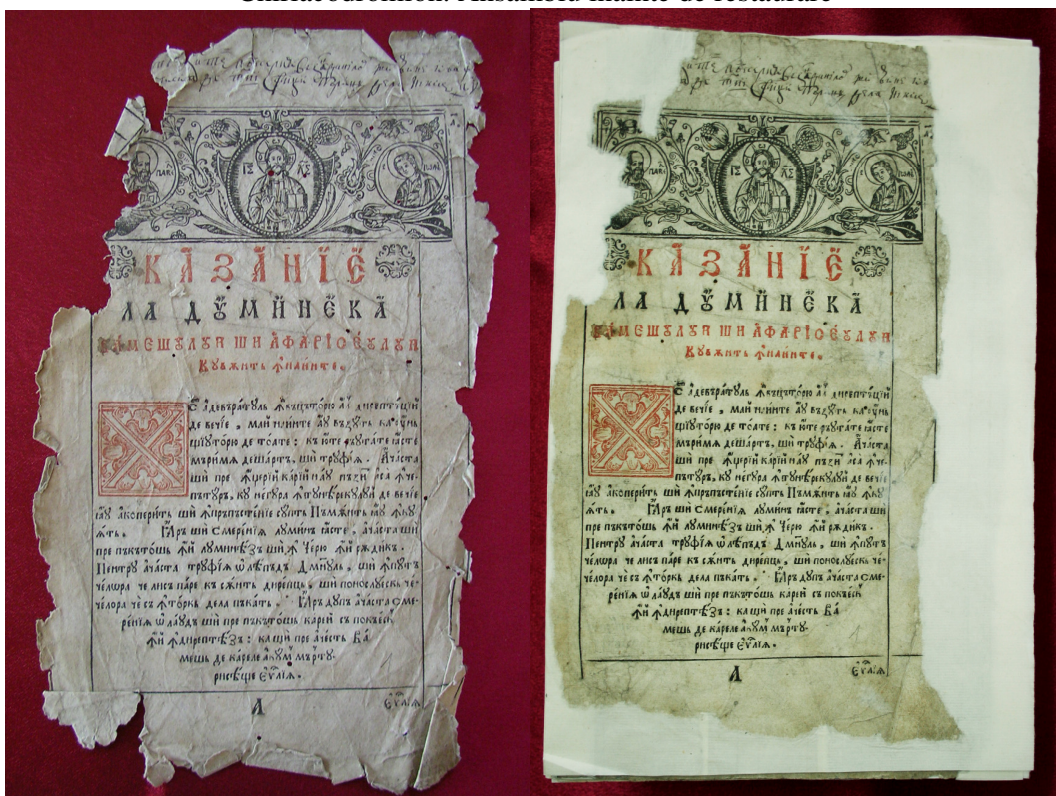
Prima filă înainte de restaurare