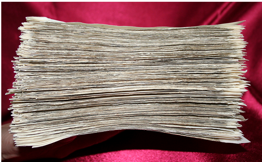
Chiriadromion. Ansamblu după restaurare