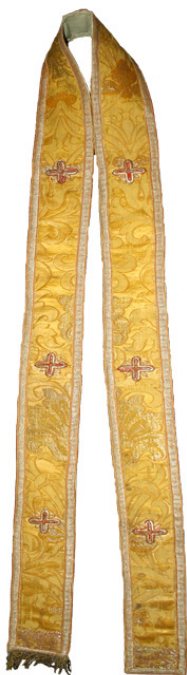
Ansamblu după restaurare