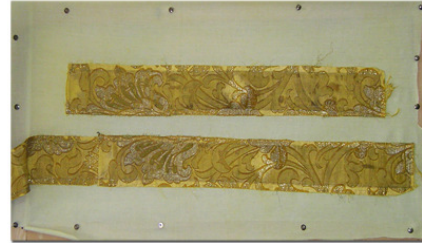
Detaliu în timpul restaurării