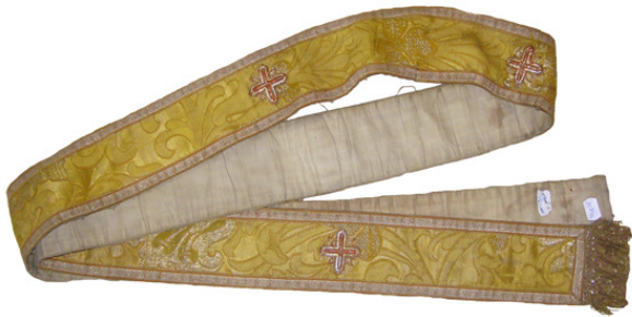
Ansamblu înainte de restaurare