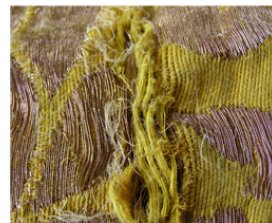
Detalii după restaurare