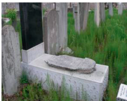
Fig. 1. Monument funerar cu piatră veche și cea nouă culcată orizontal (cimitirul evreiesc ortodox din Satu Mare)