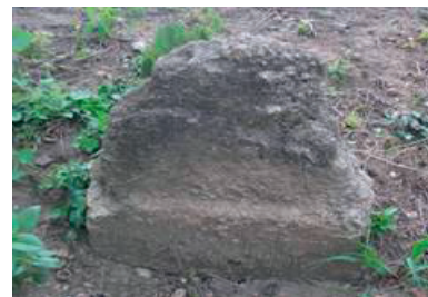
Fig. 3. Monument funerar care nu păstrează nici forma inițială, nici decorul (cimitirul evreiesc ortodox din Satu Mare)