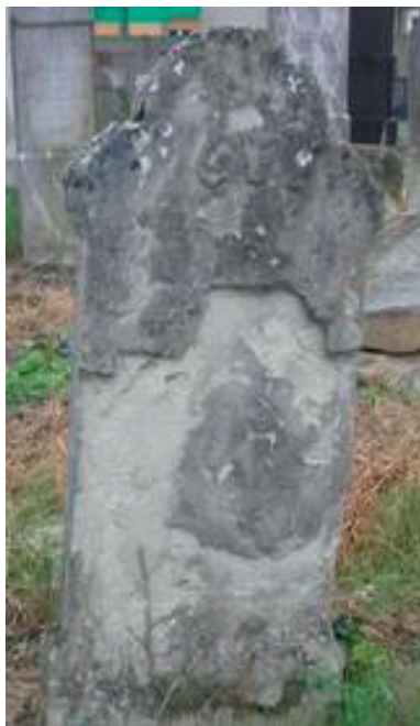
Fig. 2. Piatră funerară scorjită (cimitirul evreiesc ortodox din Satu Mare)