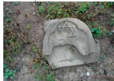
Fig. 4. Monument funerar sfărâmat, așezat grămăjoară (cimitirul evreiesc ortodox din Satu Mare)