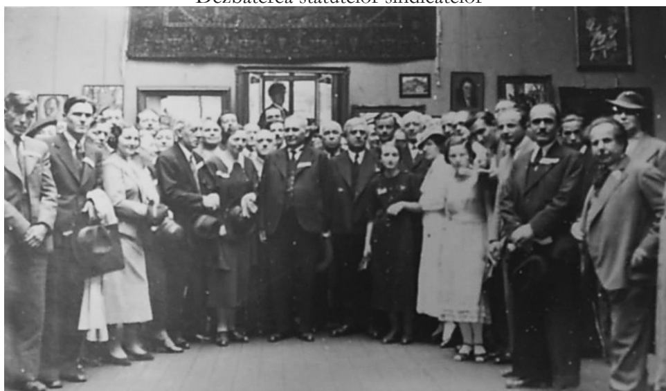
Primul Congres al Artiștilor Plastici din Ardeal și Banat – Baia Mare, 14-15 iunie 1936. În sala de expoziții a artiștilor din Baia Mare