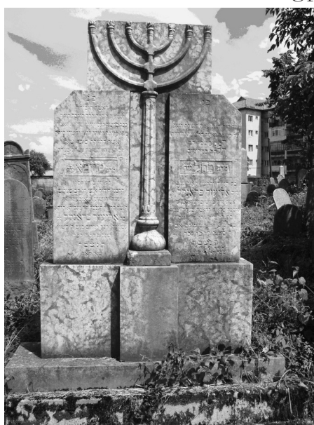
Fig. 3. Menoră. Cimitirul vechi din Oradea