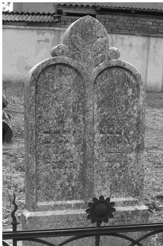
Fig. 6. Piatră funerară simbolizând tablele legii. Cimitirul ortodox Satu Mare