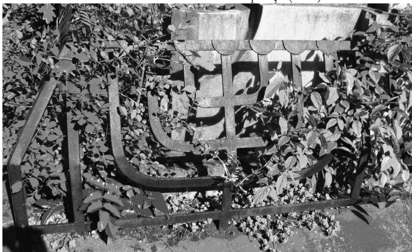
Fig. 2. Menoră din fier forjat din împrejurirea unui mormânt. Oradea, cimitirul neolog