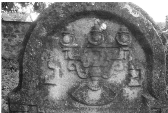
Fig. 5. Menoră cu trei brațe. Cimitirul din Sighetu Marmăției (MM)