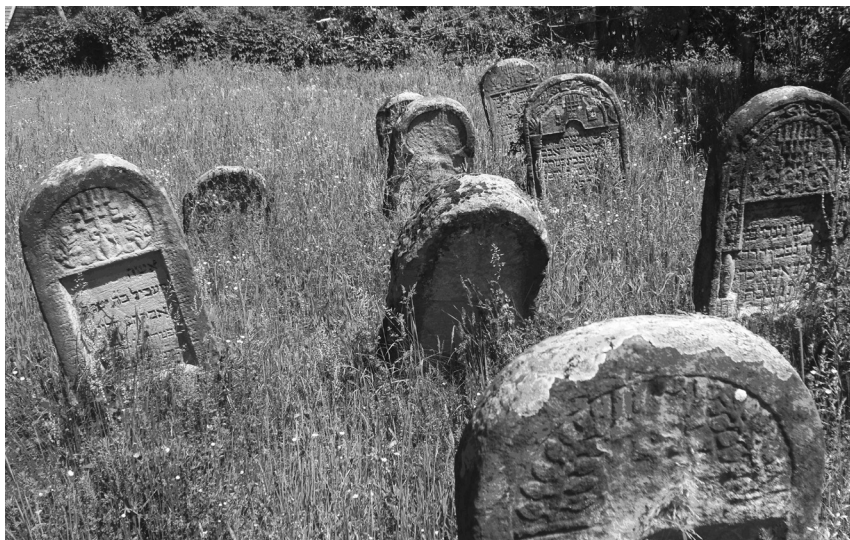
Fig. 1. Grup compact de monumente funerare cu simbolul menorai. Cimitirul evreiesc din Săpânța (MM).