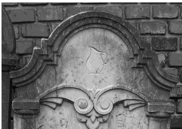
Fig. 8. Vas ritual. Cimitirul ortodox Satu Mare