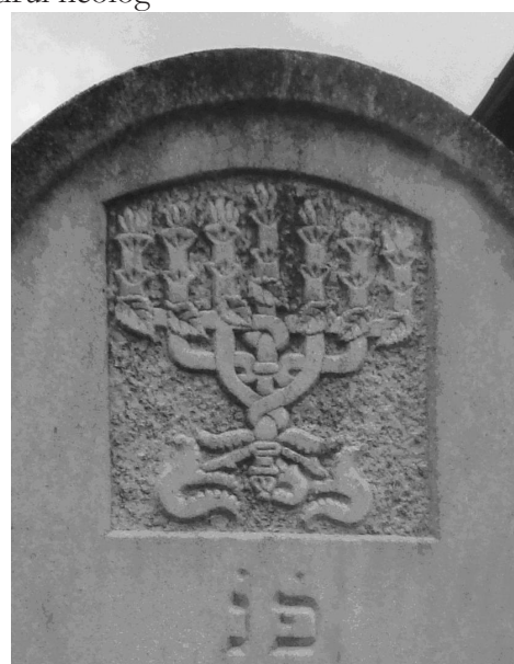
Fig. 4. Menoră din vreji vegetali. Cimitirul Sighetu Marmăției (MM)