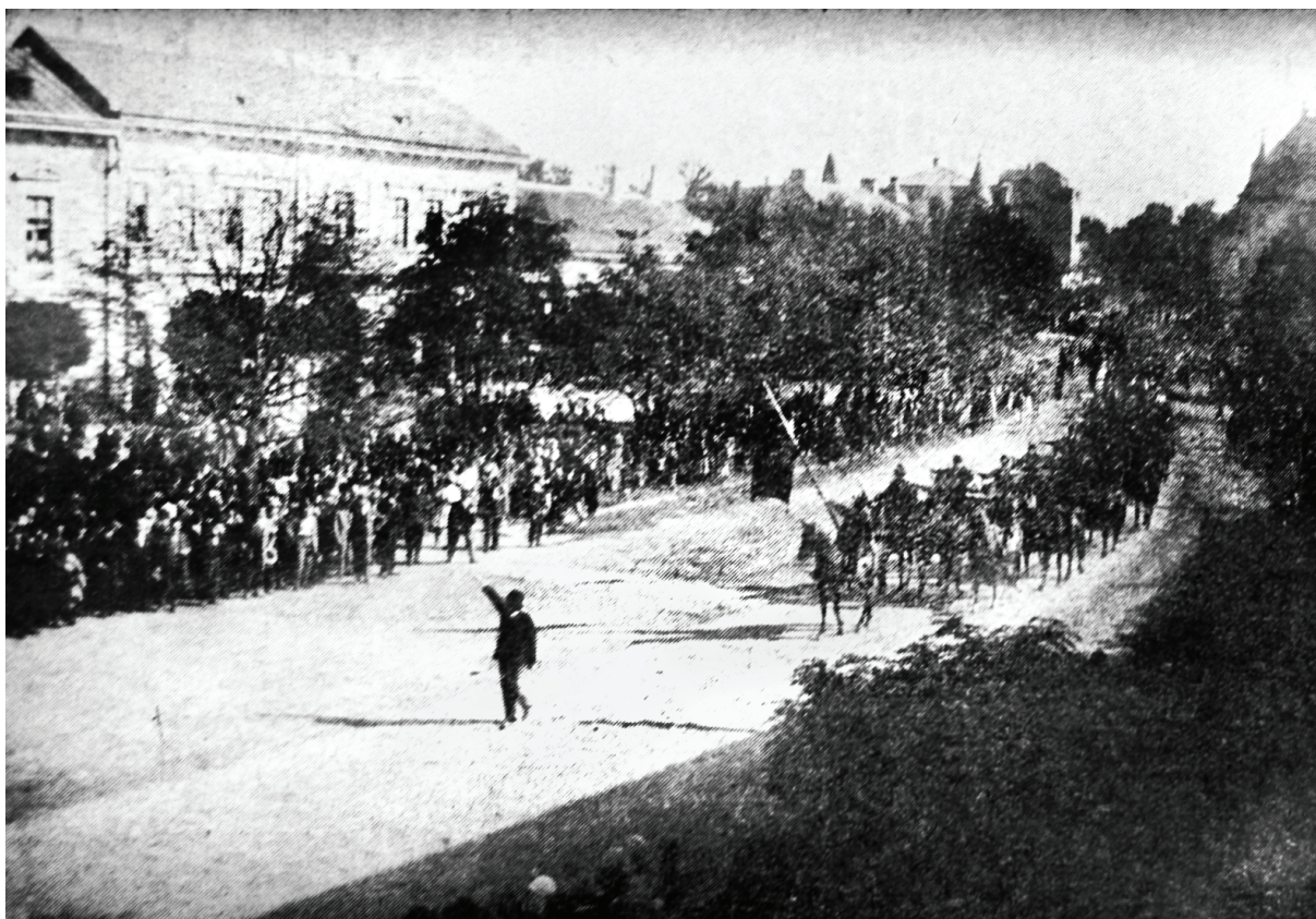
Adunare de Voinici la Carei