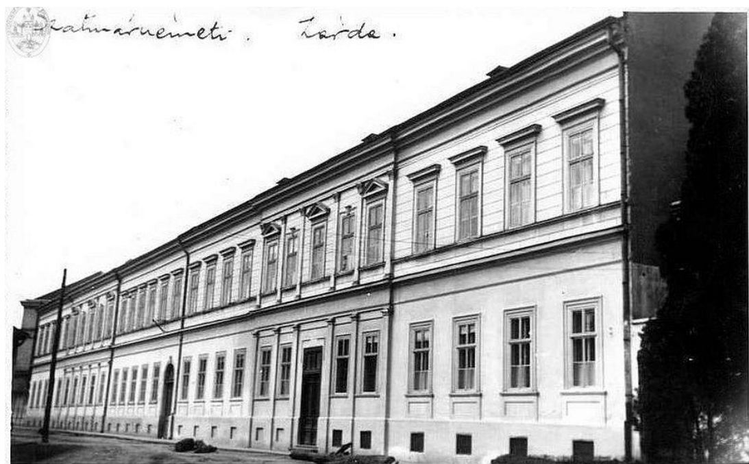
Clădirea utilizată de Școala Civilă Romano-Catolică de Fete construită în 1892 (corp B – Colegiul Național „Ioan Slavici Satu Mare”).