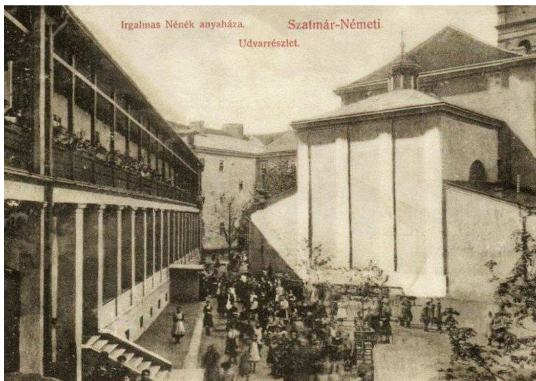
Fațada nordică (dinspre curte) a aceleiași clădiri.