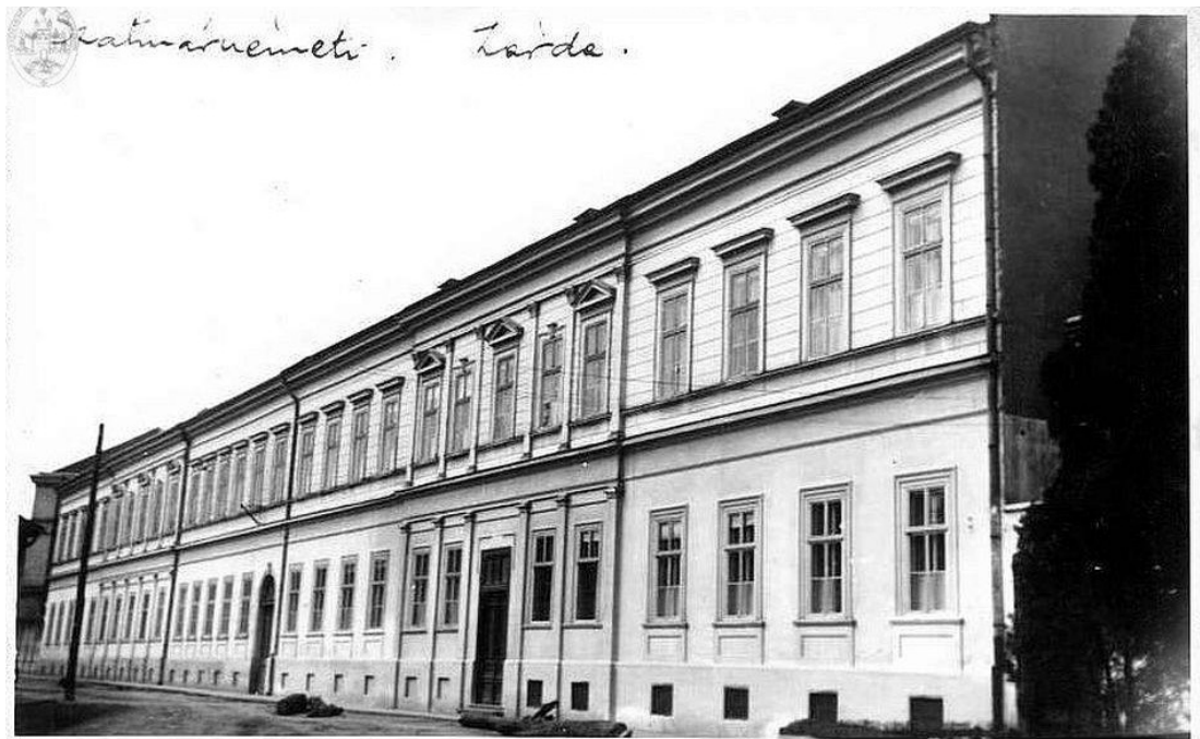
Clădirea utilizată de Școala Civilă Romano-Catolică de Fete construită în 1892 (corp B – Colegiul Național „Ioan Slavici Satu Mare”).