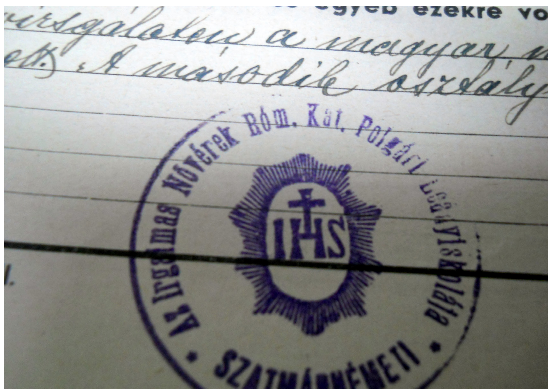
Ștampila Școlii Civile Romano-Catolice de Fete în anul școlar 1943-1944.