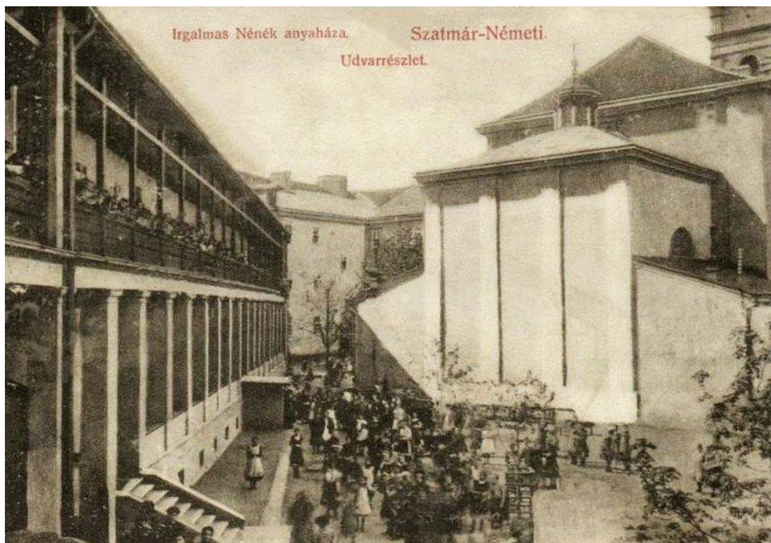
Fațada nordică (dinspre curte) a aceleiași clădiri.