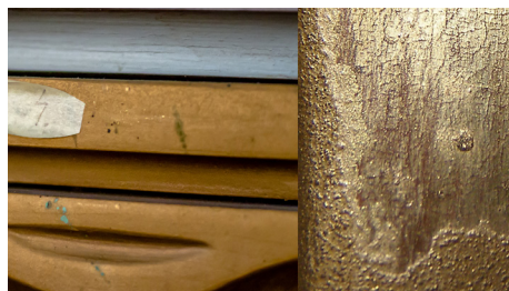
Aliaj metalic Cu-Zn (conform test 849) la suprafață și foiță de aur sub acesta

Starea de conservare este rezultatul cumulării în timp a acțiunii factorilor interni și