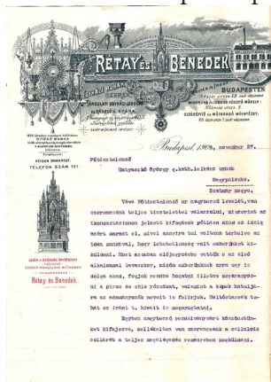
Correspondența firmei Retay & Benedek cu Parohia Greco-Catolică Peleş

Registrul 2 cuprinde 12 icoane cu Praznicele Împărățești grupate câte 6 având în mijloc o icoană de asemenea pe tablă, încadrată într-o cutie închisă cu o ramă cu sticlă. Icoanele sunt rotunjite în partea de sus și despărțite de coloane imitând același stil ionic al coloanelor mari din registrul de jos. Partea rotunjită superioară este subliniată de rame profilate aurii care pornesc din extremitatea superioară a coloanelor. Registrul 3 cuprinde 12 icoane cu reprezentări ale Apostolilor, iar așezată central apare o icoană pe un panou traforat, o icoană ce reprezintă pe Iisus Împărat. Pictura icoanelor cu reprezentările apostolilor este executată pe pânză întinsă pe șasiu dreptunghiular. Icoanele sunt încadrate de rame și însoțite în partea superioară și cea inferioară de elemente decorative cu motiv vegetal (frunze de acant și vrejuri), toate acestea despărțite de stâlpișori cu caneluri și la fel ca și stâlpii principali sunt acoperiți de vopsea de duzină, ca urmare a unei intervenții ulterioare. Restaurarea icoanelor urmărește punerea în valoare a reprezentărilor ce au suferit diferite degradări în timp din cauza condițiilor de păstrare sau au fost falsificate prin repictări. Practic, restauratorul încearcă să readucă în actualitate aspec-