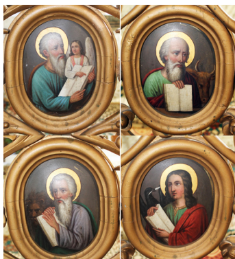
Fotografia de detaliu cu cele patru medalioane cuprinse în ușa împărătească

Ușile împărătești și cele diaconești conțin în mijlocul traforului sculptat, medalioane pictate. Suportul de tablă al medalioanelor este din tablă de fier zincată. Pictura în ulei a fost executată în pastă lisă, fără strat de preparare și fără strat de protecție (verni).