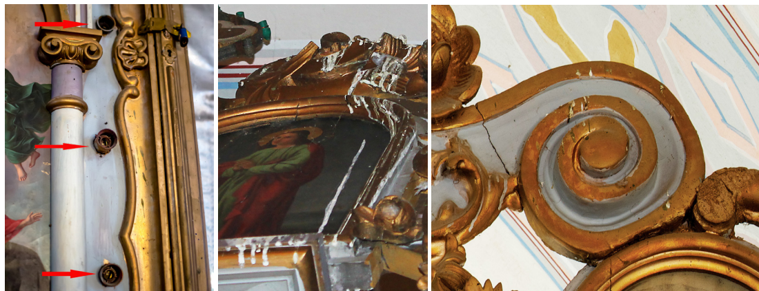
Dulii funcționale instalate în corpul iconostasului Excremente depuse pe partea superioară a iconostasului Urme ale repictării cu vopsea industrială și fisuri în masa lemnoasă Degradarea suportului de lemn

Elementele decorative ale registrului 4 și ramele ce încadrează icoanele proorocilor bănuim că fac parte din vechiul iconostas sau probabil doar elementele decorative cu motiv vegetal. Ele sunt acoperite cu foiță de aur și ulterior după ceva timp ele au suferit o intervenție și anume au fost acoperite cu bronz aplicat cu pensula. Ca și în alte cazuri, (și la alte iconostase) observăm intervenții ale neștiinței oamenilor care din dorințe mai mult sau mai puțin discutabile, au montat un sistem de iluminare al iconostasului, un sistem electric de becuri care pe lângă faptul că prezintă pericol de incendiu, penetrează corpul iconostasului cu 55 de dulii cu becuri.