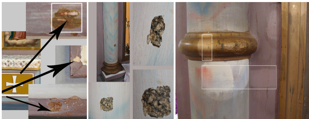
Teste de îndepărtarea vopselei industriale și a bronzului pensulat peste foia de aur.

Tradiția Bisericii afirmă că prima icoana a lui Hristos a apărut încă din timpul vieții Sale pământești. Era imaginea numită în Occident „Sfântul Chip”, iar în Biserica creștină răsăriteană „imaginea nefăcută de mâna omenească”. 3