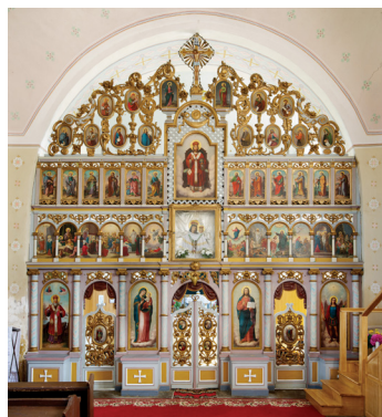
Imagine generală a iconostasului

Iconostasul cu dimensiunile de 700x672 cm are o structură confecționată din lemn de molid ( Picea abies ), de asemenea capacele, blaturile care susțin icoanele și șasiurile sunt confecționate din același material, acestea sunt debitate cu unelte specifice unui atelier de confecționat obiecte din lemn și îmbinarea este manuală. Elementele traforate din registrul superior – registrul 4 - elemente care făceau parte din vechiul iconostas sunt confecționate din lemn de tei ( Tilia ).