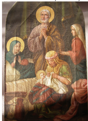
Lumină razantă, degradări ale pânzei, se văd craclurile care s-au dezvoltat pe forma șasiului din spate

de a astupa porii suportului și a înlătura absorbția liantului, încât pictura să nu prezinte pete discordante, mate sau lucioase. De aceea, grundul are o foarte mare importanță.