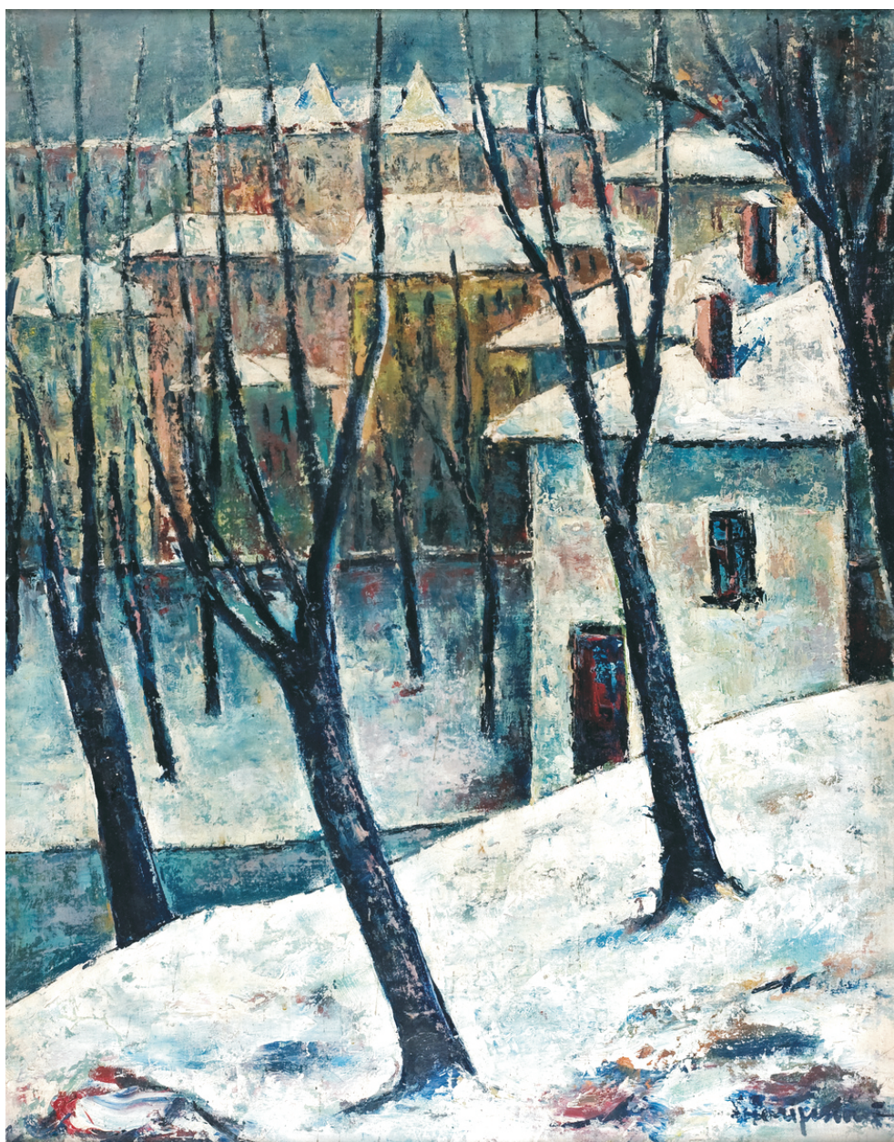
VASILE PARIZESCU (1925) - Zile de iarnă Ulei pe pânză lipită pe carton; 61 x 50 cm. Semnat dr. jos cu albastru: V. Parizescu. Nedatat Colecția Alex. Andrei Mărculescu