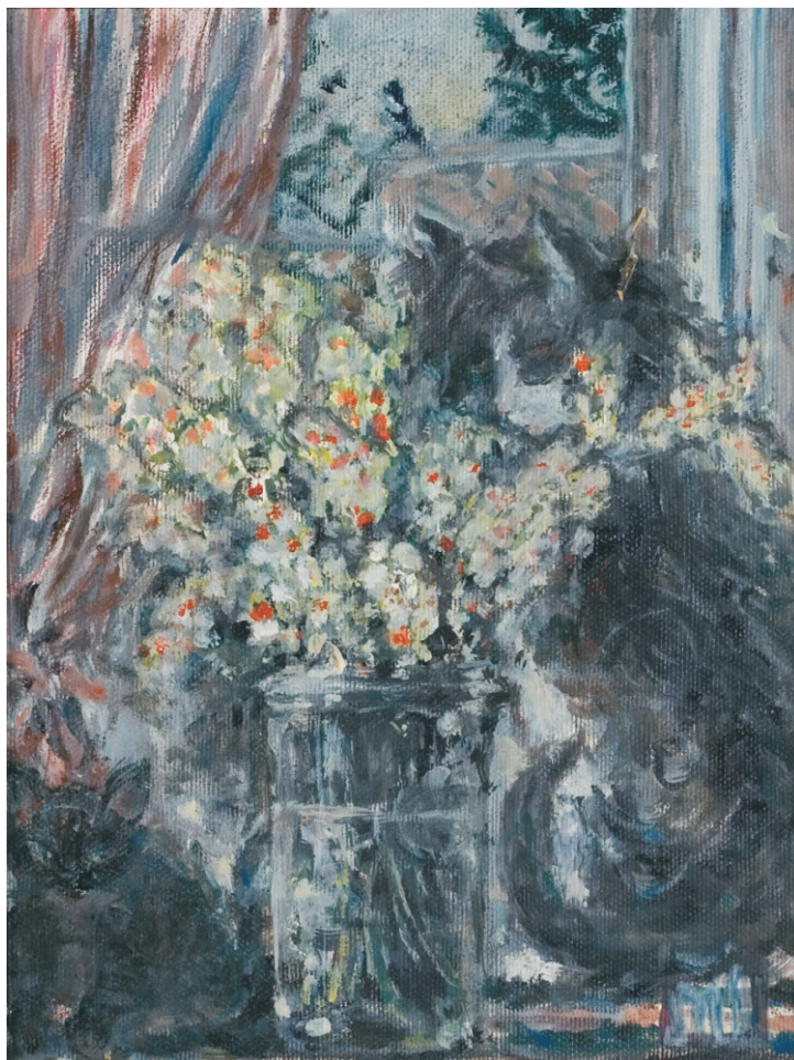
MAGDA ISĂCESCU (1943) - Prima zăpadă, ultimele flori Ulei pe pânză; 24 x 18 cm. Semnat în monogramă stg. jos, cu albastru: M.I. Nedatat Colecție particulară