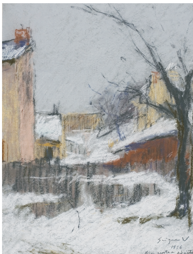
VASILE GRIGORE (1935) - Din curtea părintească Tehnică mixtă pe hârtie; 27 x 21 cm. Semnat și datat, însemnare dr. jos în creion: Grigore v., 1956, Din curtea părinților Colecția Boris Paraschivescu