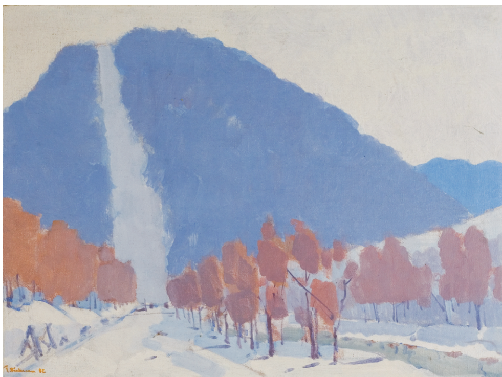
TEODOR RĂDUCAN (1938) - Revelație (Cumpătu - 82) Ulei pe pânză lipită pe carton; 44 x 57 cm. Semnat și datat stg. jos cu oranj: T. Răducan, (19)82 Colecție particulară