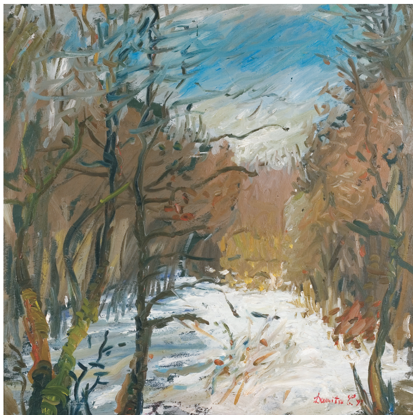
CONSTANTINA DUMITRU (1946) - Iarna la Băneasa Ulei pe pânză; 49,5 x 49,5 cm. Semnat și datat dr. jos cu roșu: Dumitru C., (19)99 Colecție particulară