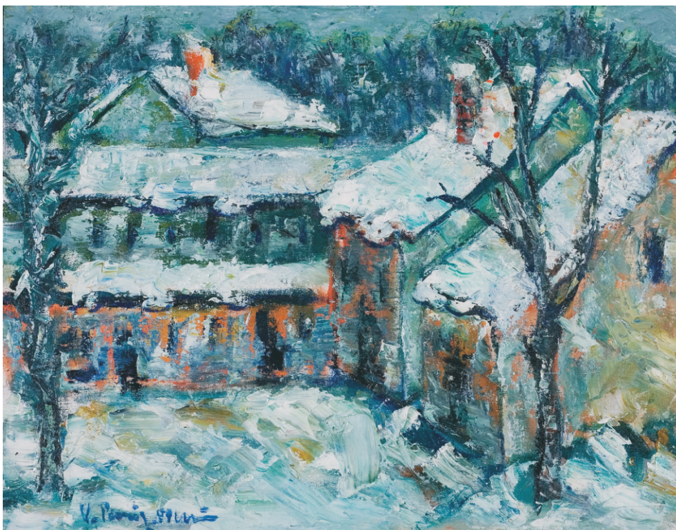
VASILE PARIZESCU(1925) - Iarna la depozitul de armament Ulei pe pânză, 40 x 50 cm. Semnat stg. jos cu albastru: V. Parizescu. Nedatat Colecția Teodora Dumitrescu