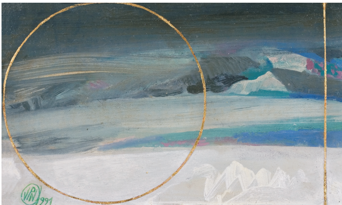
VASILE POP NEGREȘTEANU (1955) - Viscolul iernii

Ulei pe carton; 18 x 30,5 cm. Semnat în monogramă și datat stg. jos cu verde: VPN, 1991