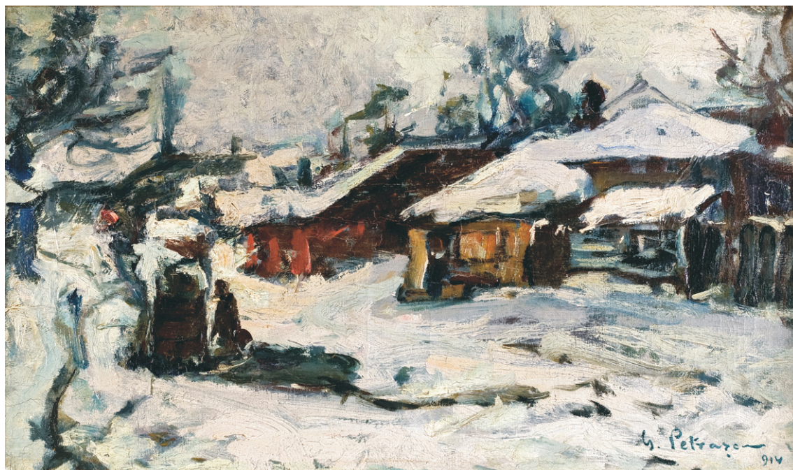
GHEORGHE PETRAȘCU (1872 - 1949) - Iarna pe uliță