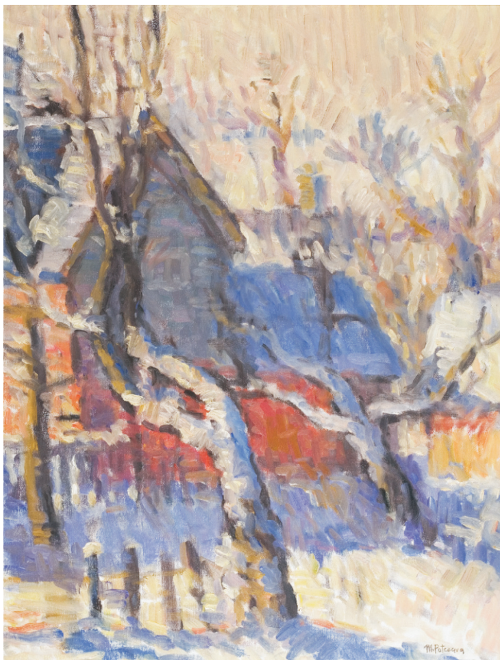
MIHAI POTCOAVĂ (1948) - Iarna la Bran - II Ulei pe pânză; 65 x 50 cm. Semnat dr. jos cu gri: M.Potcoavă, datat pe verso: 2006 Colecție particulară