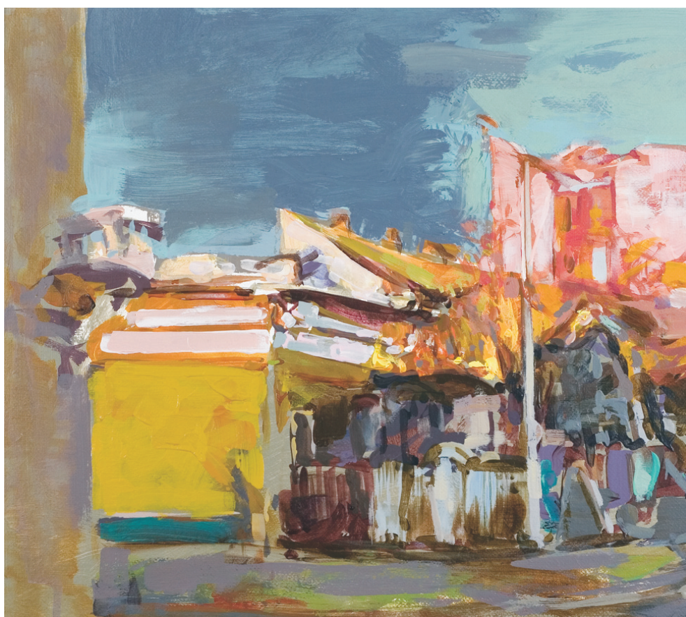
FLORIN BÂRZĂ (1956) - Ger de plumb în București Acrilic pe pânză; 56 x 65 cm. Semnat central jos, cu gri: Bârză, datat pe verso: 2009 Colecția Cristina și Marius Tița