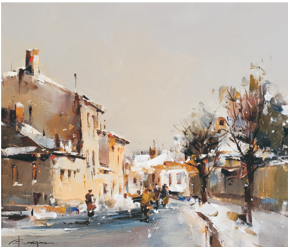
CORNELIU DRĂGAN - TÂRGOVIȘTE (1956) - Stradă din București – Iarnă Ulei pe pânză; 33 x 38 cm. Semnat stg. jos cu brun: C.Drăgan. Nedatat Colecția G&K Patzelt