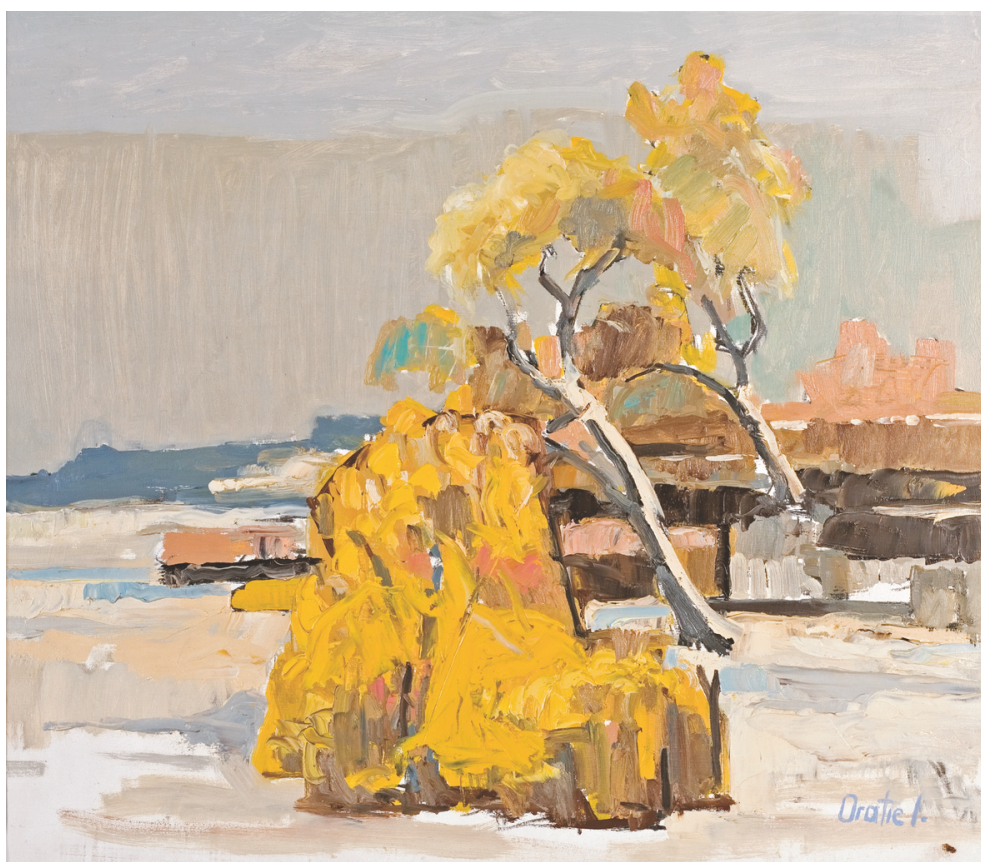
IOAN ORATIE (1957) - La marginea satului

Ulei pe pânză; 65 x 72 cm. Semnat dr. jos cu gri: Oratie I, datat pe verso : 2008