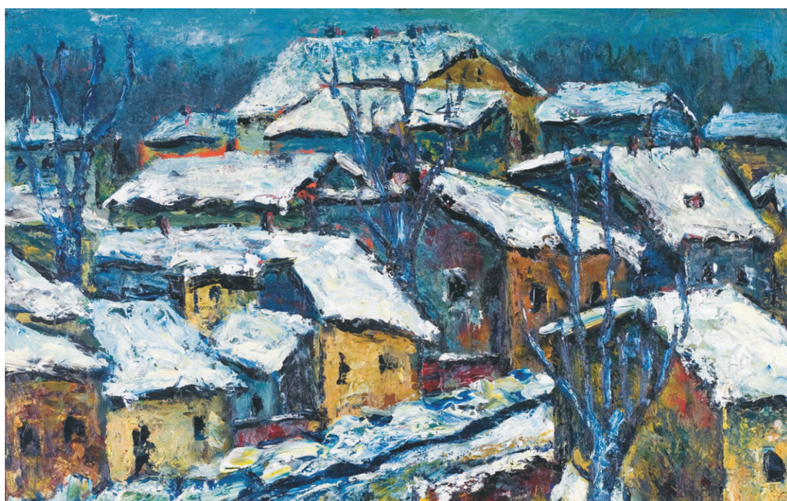
VASILE PARIZESCU (1925) - Strada Roșiori - Brăila Ulei pe pânză lipită pe carton; 49,5 x 70 cm. Semnat stg. jos cu albastru: V. Parizescu. Nedatat. Colecția Radu Hazgan