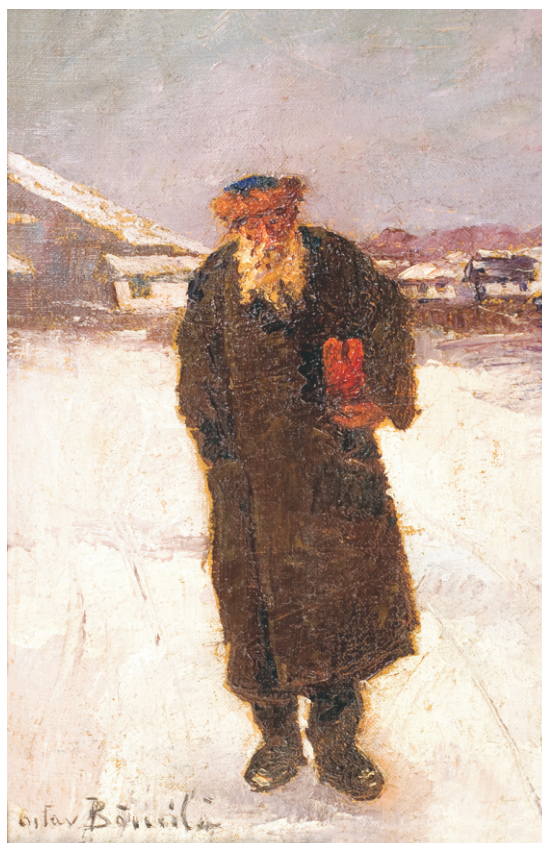
OCTAV BĂNCILĂ (1872 - 1944) - Evreu cu Talmud din Mahalaua Cucului – Iași