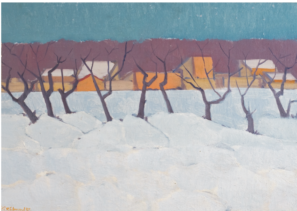
TEODOR RĂDUCAN (1938) - Iarnă la Străulești Ulei pe pânză lipită pe carton; 31 x 47 cm. Semnat și datat stg. jos cu oranj: T. Răducan, (19)82 Colecție particulară