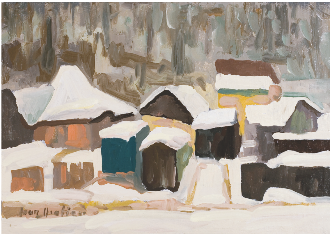
IOAN ORATIE (1957) - Liniște

Ulei pe pânză; 35 x 50 cm. Semnat stg. jos cu gri: Ioan Oratie, datat pe verso: 2010