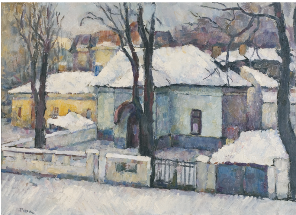
VASILE POPA (1957) - Iarna pe str. I.L. Caragiale Ulei pe pânză; 50 x 70 cm. Semnat stg. jos cu negru: Popa. Nedatat Colecția Florica și Vasile Petrovici