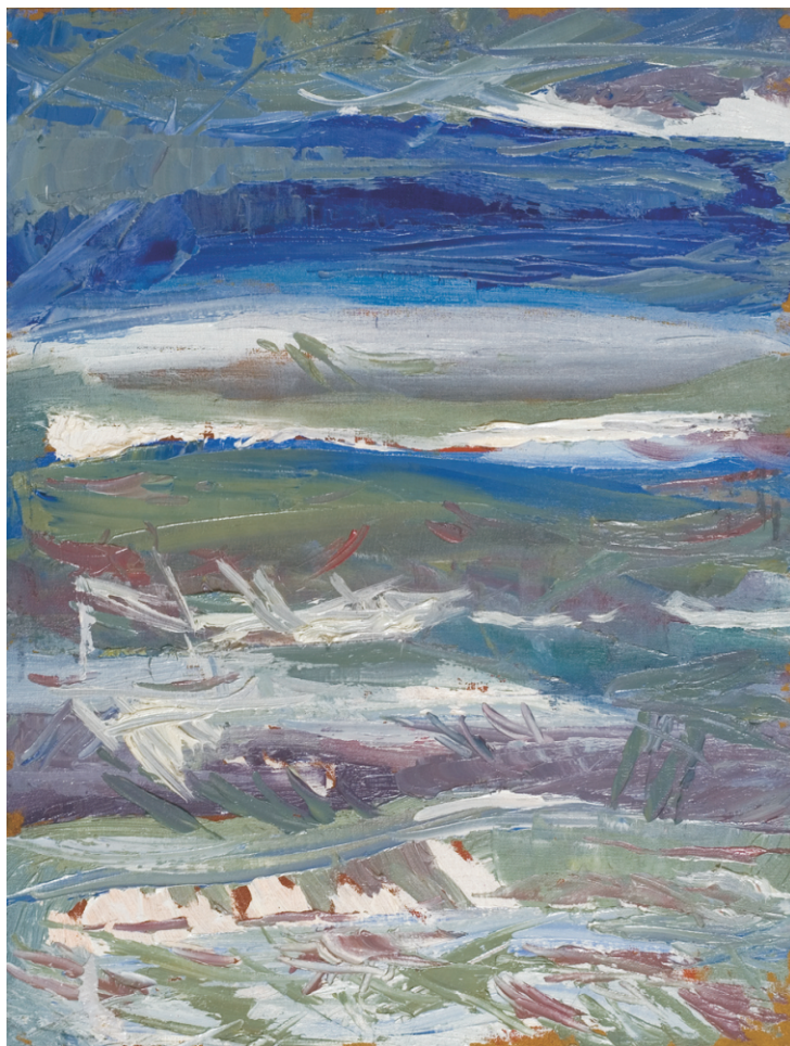
HORIA NIȚU (1981) - Marea iarna Ulei pe pânză; 42 x 32 cm. Nesemnat, nedatat Colecție particulară