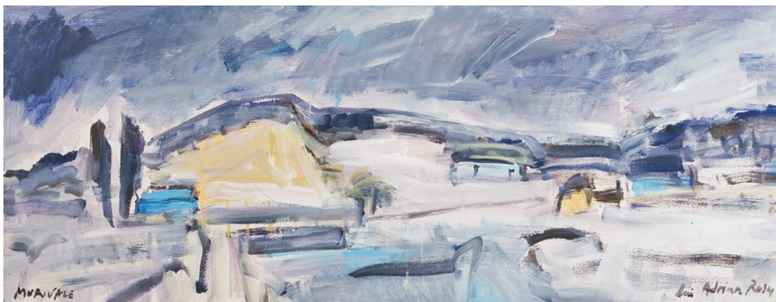
VASILE MUREȘAN MURIVALE (1957) - Iarna la Bistrița Acrilic pe pânză; 35 x 90 cm. Semnat stg. jos cu negru: Murivale. Nedatat Colecție particulară