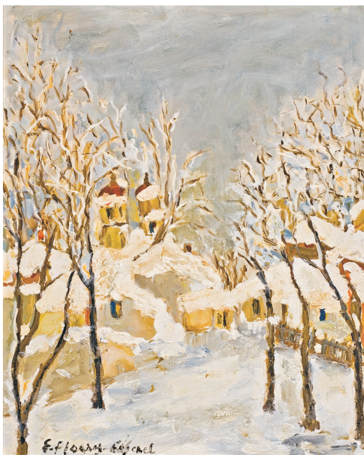
ELENA FLOAREȘ COJENEL (1942) - Iarnă cu biserică Ulei pe pânză; 50 x 40 cm. Semnat stg. jos cu negru: E. Floareș Cojenel. Nedatat Colecția Dorin Mihalache