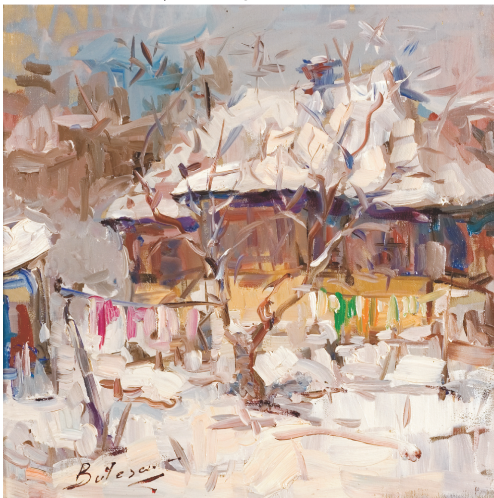
VITALIE BUTESCU (1972) - Iarna Ulei pe pânză; 30 x 30 cm. Semnat stg. jos cu brun: Butescu. Nedatat Colecția G&K Patzelt