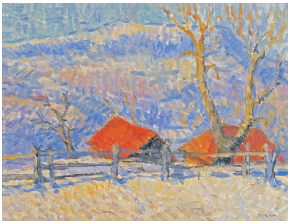
MIHAI POTCOAVĂ (1948) - Iarna la Bran - I Ulei pe pânză; 50 x 65 cm. Semnat dr. jos cu gri violet: M.Potcoavă, datat pe verso: 2006 Colecție particulară