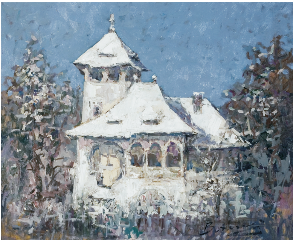
VITALIE BUTESCU (1972) - Vila Minovici

Ulei pe pânză; 50 x 60 cm. Semnat stg. jos cu negru: Butescu. Nedatat Colecție particulară