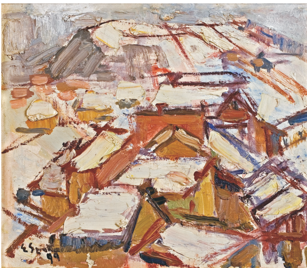
ELENA SZERVACZIUS (1932) - Iarna la Dej Ulei pe pânză; 28,5 x 35 cm. Semnat și datat stg. jos cu brun, cu inițiale: E. Sz. (19)99 Colecția Irina și Liviu Gavrilescu