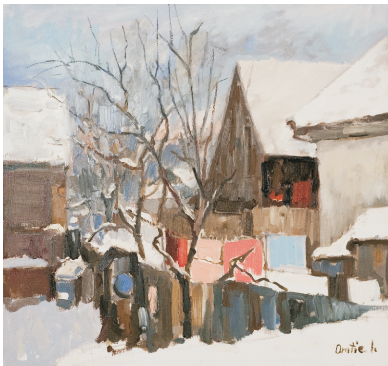
IOAN ORATIE (1957) - Rufe iarna

Ulei pe pânză; 52,5 x 56,5 cm. Semnat dr. jos cu brun: Oratie I, datat pe verso : 2005