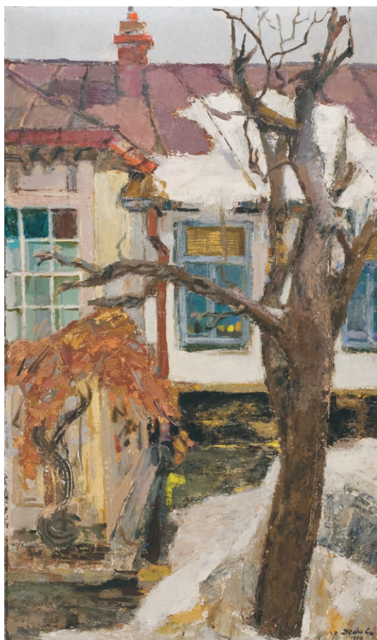
CORNELIA VICTORIA DEDU (1942) - Iarna gutuiului

Ulei pe pânză; 50 x 60 cm. Semnat stg. jos cu negru: Butescu. Nedatat Colecție particulară