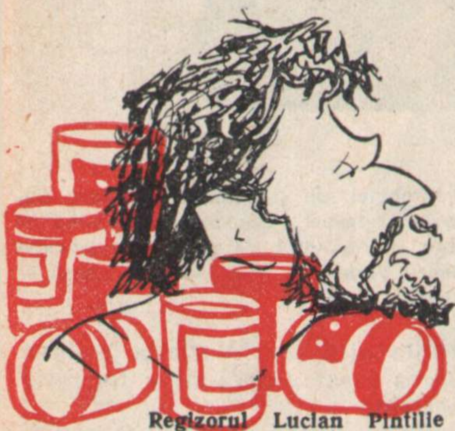
Regizorul Lucian Pintilie

Nimic nu este poate mai ne la locul lui, decît povestirea subiectului unei farse. De aceea nu vă