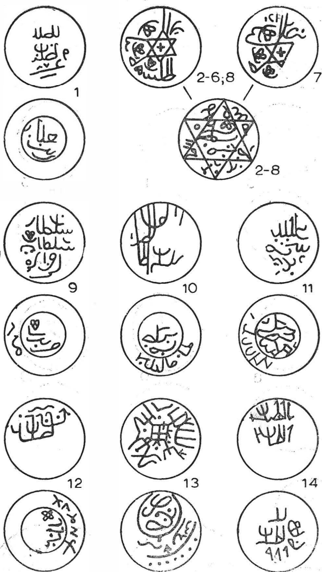
Fig. 2. Dirhemi otomani falși (desene).