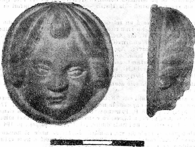
Fig. 1. Camee reprezentînd pe Eros, descoperită la Capidava.

Lucrată din calcedonie alb-lăptoasă cu puncte maronii și o vină subțire de aceeași culoare, cameea este de formă ovală având următoarele dimensiuni: d_1 = 3,8 cm; d_2 = 3,3 cm; g = 1,6 cm. 2 Pe avers, în relief înalt, este sculptat — cu grijă excesivă pentru detalii și cu o perfecțiune a execuției greu de egalat 3 — un cap cu fața rotundă, buclată, bărbia proeminentă, cu gropiță, ochii migdalați, în arcade proeminente, fruntea înaltă, bombată, nasul scurt și drept cu aripile nărilor ușor reliefate. Gura este mică, cu buze subțiri, buza de sus fiind ușor arcuită, ușor avansată față de cea de jos și avind deasupra, pe centru, o șanțuire. Părul scurt, până la nivelul nasului, acoperind urechile, este pieptănat cu cărare la mijloc, în onduleuri largi, continue. Din creștetul capului, pe fruntea personajului atîrnă o buclă lungă de păr.