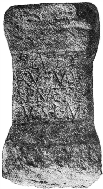
Fig. 2. Altar votiv de la Micla.

[P]LVTO RVFVS PRAEF(ectus) V(otum) S(olvit) L(ibens) M(erito)