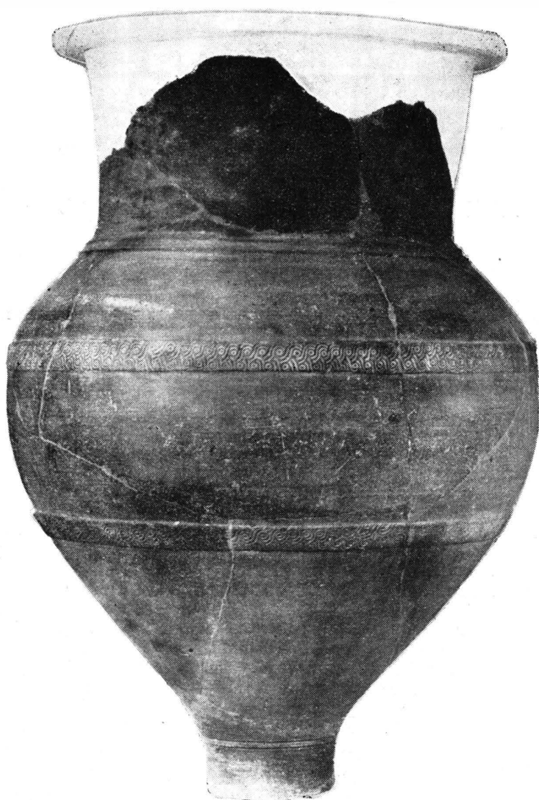
Fig. 1. — Pithos arhaic descoperit la Histria, cu decor de tresă dublă , stampat pe două benzi circulare în relief.