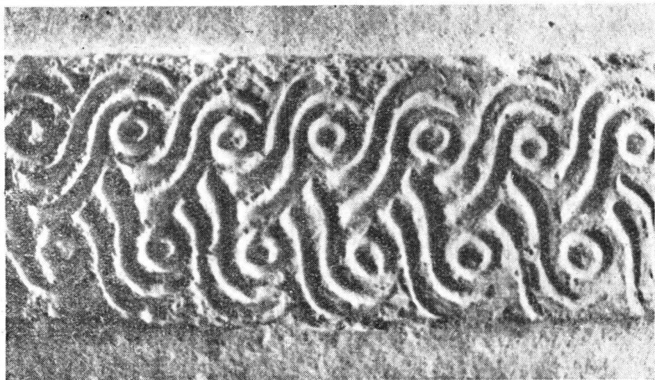
Fig. 2. — Detaliu cu motivul de tresă dublă de pe benzile chipului de la fig. 1.

arcuit, și se termină la prima dintre cele două benzi circulare în relief cu decor stampat, ce împodobesc și delimitează pansa chiupului. Diametrul maxim se află situat la distanța de 7 cm sub banda superioară de decor, dar putem vorbi chiar de o zonă de maxim diametru, căci de la banda superioară și pînă la punctul amintit, diametrele sînt aproape egale. De la banda inferioară în jos, pînă la picior, forma vasului e aceea a unui trunchi de con răsturnat cu contur imperceptibil convex.