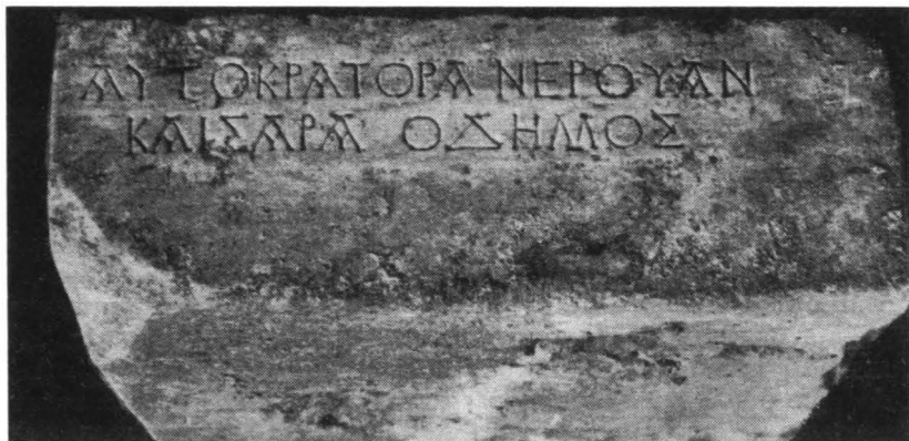
Fig. 2. — Aceeași bază. Inscripția de pe latura scurtă (răsturnată).

să mențină stăpînirea romană cel puțin într-o parte din Sciția năpădită de gôți și revendicată de huni. « Cum aceștia din urmă ocupaseră punctele întărite din jumătatea nordică a provinciei, împreună cu Carsium și Noviodunum, — scrie în această privință Radu Vulpe în a sa Histoire ancienne de la Dobroudja , — împăratul roman (e vorba de Theodosiu al II-lea) se văzu nevoit să fixeze un nou limes mai spre sud, înălțînd un impunător val de pămînt între Tomis și Axiopolis, pe cel mai scurt traseu. Sub presiunea evenimentelor . . . această lucrare, începută