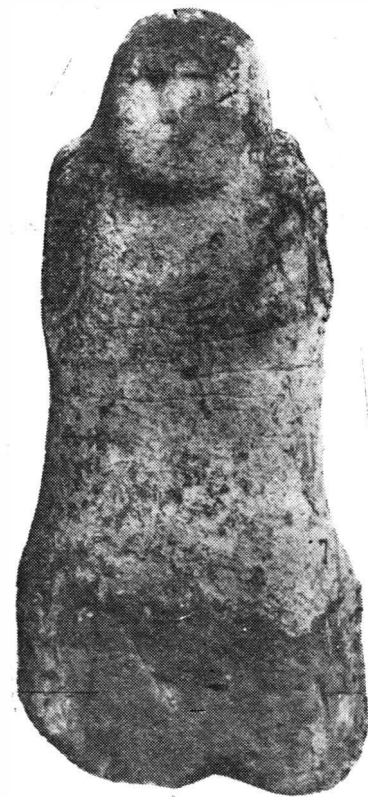
Fig. 3. — Statuia din Dobrogea.

Statuile de piatră ne dau și amănunte prețioase în legătură cu felul de se purta armele la populația care le ridica. Pumnalul sau sabia scurtă se purta în teacă atîrnată oblic prin prelungirea laterală a tecii spre șoldul drept sau în față, așa încît să poată fi ușor scos din teacă 2 . Acest amănunt este important, căci din descoperirile făcute în morminte era greu de stabilit poziția pumnalului, ținînd seama că în majoritatea mormintelor bogate, inventarul este așezat separat, iar din arta greco-scitică cunoaștem acest sistem de a se purta pumnalul numai de pe aplica goryth-ului de la Soloha 3 . Un fel deosebit de purtare a pumnalului ne este arătat de statuia de la Sibioara unde arma de tipul scurt, fără teacă, este atîrnată de centură la șoldul drept, așa cum