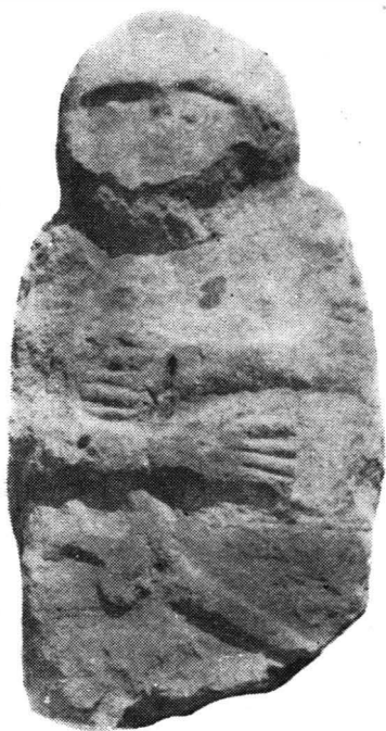
Fig. 1. — Statuia de la Stupina.

direct pe umerii mai pronunțat modelați. Corpul, relativ oval în secțiunea orizontală, are talia marcată prin arcuirea părților laterale. Ceea ce deosebește însă această statuie de prima este faptul că brațele și centura sînt redată prin linii adîncite. Poziția brațelor este asemănătoare cu cea de la prima statuie, cu deosebirea că de astă dată antebrațul drept e mai sus și cel stîng mai jos. Liniile adîncite fiind foarte neglijent trasate, mîinile apar foarte slab, la cea stîngă abia se disting trei degete, iar la cea dreaptă nu se vîd deloc. Centura așezată în dreptul taliei este de asemenea foarte neîngrijit redată. Ea nu apare decît pe fața anterioară a statuii, pierzîndu-se pe laturi. Este înfățișată printr-o linie orizontală sub antebrațul stîng. Cea de a doua linie a ei pornește din partea dreaptă a corpului paralel cu prima, pentru ca în mijlocul feții să coboare, pierzîndu-se într-una din cele trei alveolări așezate în unghi sub ea. Această statuie nu are nici o altă reprezentare, dar cele trei alveolări pomenite ar putea reprezenta locurile în care