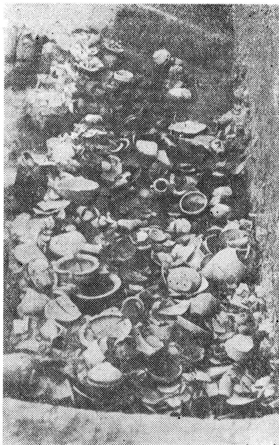
Fig. 1. Imagine cu groapa cu vase.

Bustul zeului era încadrat într-un chenar circular cu diametrul 6, 8 cm, format din puncte incizate, urmat de o alveolare ornată cu o linie șnurată, distrusă parțial în timpul retușării.