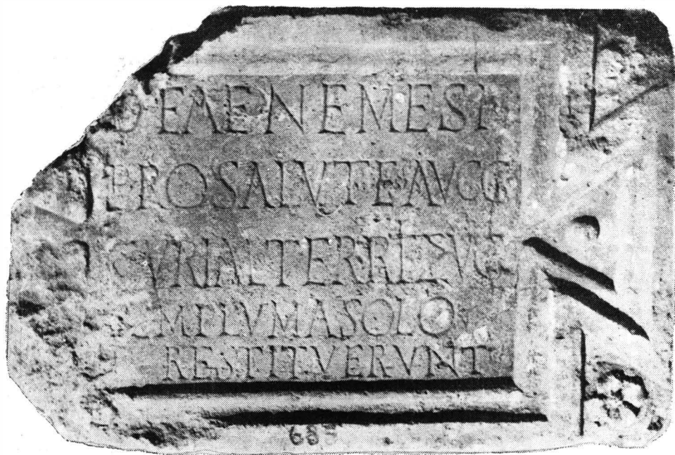
Fig. 1. — Inscripția de la Celei (Sucidava).

Traducere : „Zeitei Nemesis pentru sănătatea ambilor împărați. Curialii teritoriului Sucidăvean au refăcut templul de la temelie”.