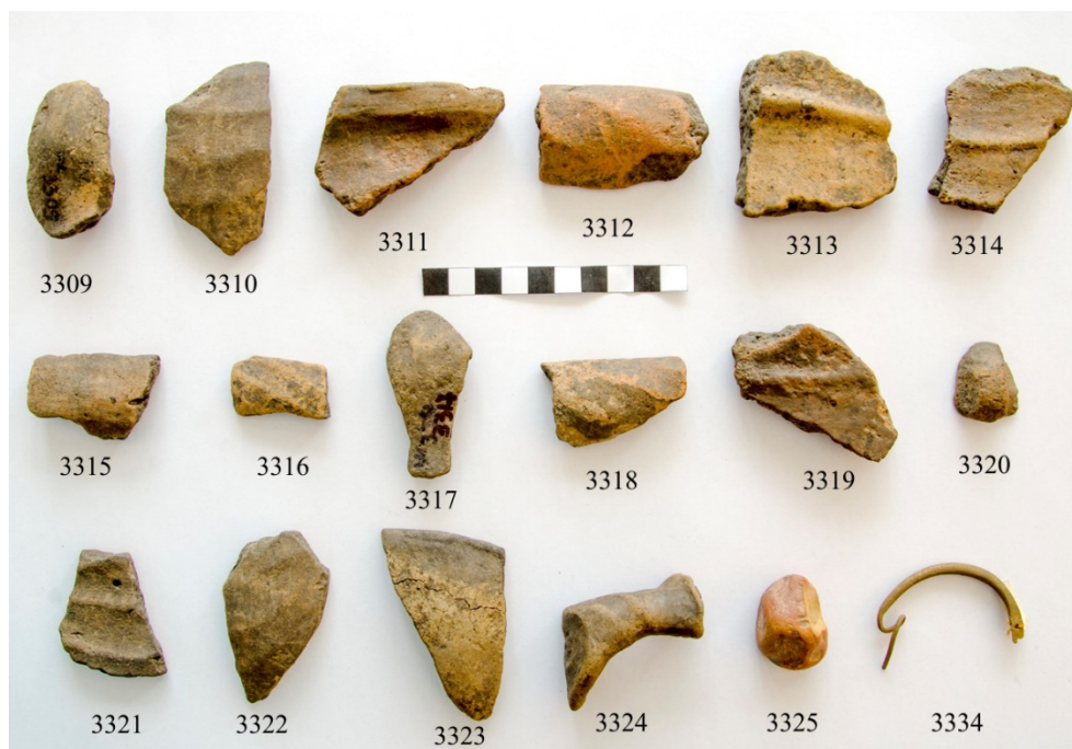
Fig. 3. Inventar arheologic (fragmente ceramice și fibulă din bronz) descoperit în săpăturile de salvare de la Stoenеști – Valea Miriuței (1989) și înregistrat în colecția de istorie veche (I. V.) a Muzeului Județean Argeș (foto D. Răcășanu).