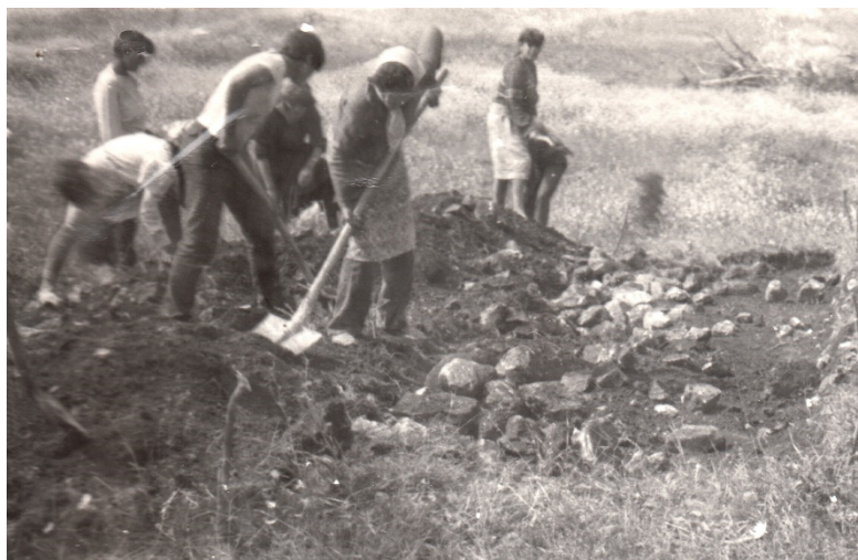
Fig. 2. Stoenеști – Valea Miriuței. Săpături de salvare, iulie 1989. Detaliu cu dezvelirea mantalei de pietre a unui mormânt tumular (foto T. Cioflan, arhiva documentară a Muzeului Județean Argeș).