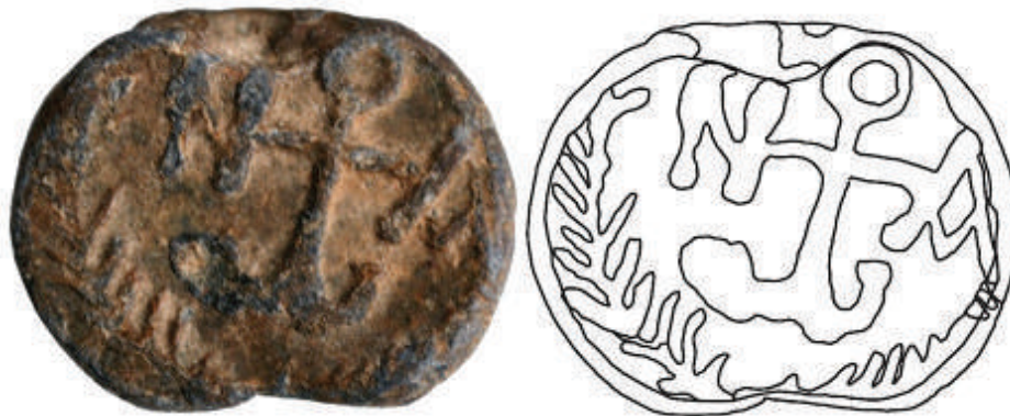
Fig. 2. Sigiliul lui Ioannes, descoperit la Fântâna Mare ( Başpunar ). Revers.

Datare: a doua jumătate a secolului al VI-lea.