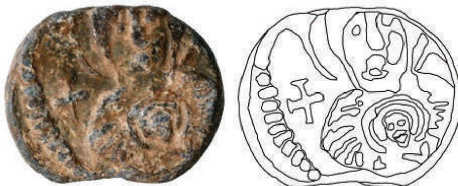
Fig. 1. Sigiliul lui Ioannes, descoperit la Fântâna Mare ( Başpunar ). Avers.

Revers: monogramă cruciformă (fig. 2). Legenda reversului este ușor descentrată spre dreapta sus. După cum am arătat mai sus, această descentrare a legendei se datorează unei neglijențe la ștanțarea plumbului. În centrul reversului, se află gravată o legendă, sub forma unei monograme cruciforme, care ascunde numele emitentului. Legenda cuprinde patru litere amplasate la capetele unei cruci. Hasta verticală a crucii este și una dintre cele cinci litere ale monogramei (I). În capătul de sus al hastei orizontale se află diftongul ov (8); în capătul de jos al aceleiași haste se află litera ω ; în capătul din dreapta al hastei orizontale se află litera a (A), iar în capătul din stânga al aceleiași haste se află litera n (N). Cele cinci litere (I, ω , A, N, 8) formează numele IΩAN(N)8.