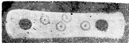
Fig. 1. Sucidava — Pirjoaia, piesă din corn de cerb.

6) Sucidava — Pirjoaia (azi Izvoarele, jud. Constanța) 20 . Aici s-au descoperit de către regretatul Vasile Culică trei piese, dintre care numai una este întreagă, rămase pînă azi incdite. Prima piesă (fig. 1), cea întreagă, are lungimea de 0,067 m, lățimea de 0,015 m și grosimea