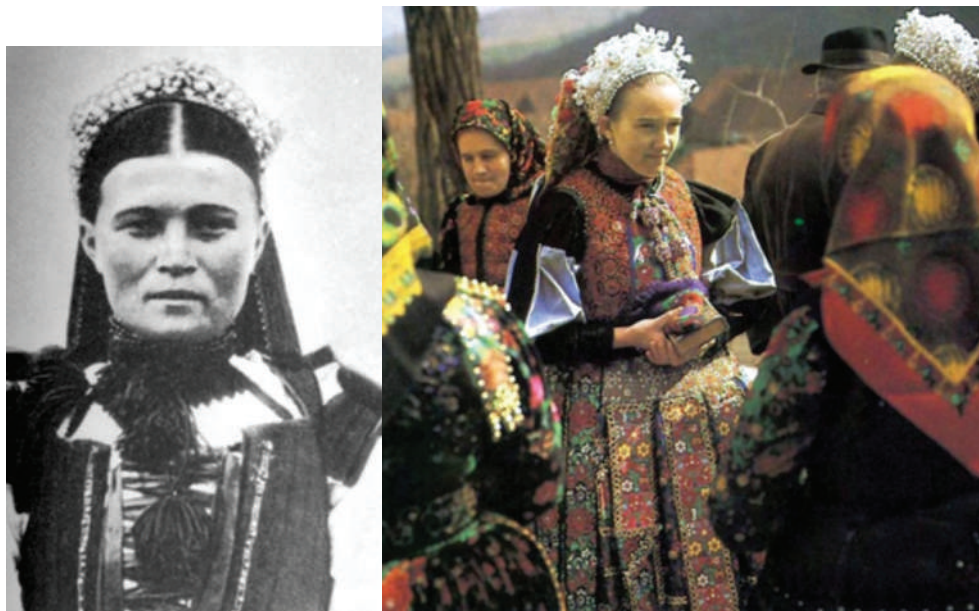
Fig. 2. Fete cu diademe decorate cu mărgel: a. Vulcani, jud. Cluj, 1894 ( http://mek.oszk.hu/02100/02115/html/img/4 ); b. Viștea, jud. Cluj, anii '70 ai secolului XX ( http://mek.oszk.hu/02100/02115/html/img/4-160r.jpg ).

opinia noastră, o analiză monografică a acestei categorii de artefacte din Bazinul Transilvaniei ne-ar oferi mai multe și mai detaliate informații socio-antropologice referitoare la realitățile epocii medievale.