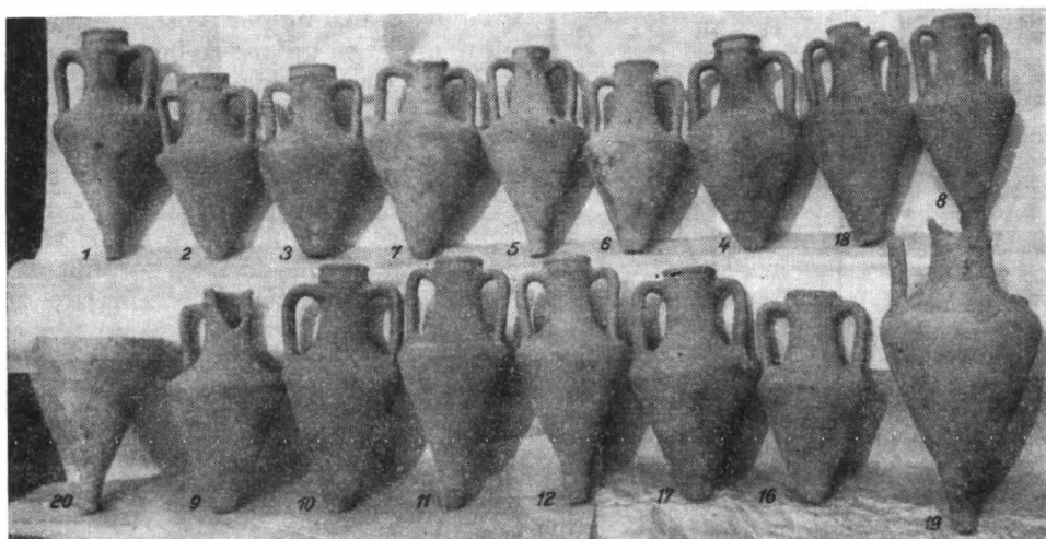
Fig. 1. — Amfore de la Islam Geaferca (numerotarea corespunde tabelului).

În nordul Dobrogei a fost dat la iveală un depozit de amfore în adîncirea văii ce se prelungea la punctul «Coadă Ripii», din partea de nord a satului Islam Geaferca, pendinte de comuna Horia (r. Măcin). Apele, ce șiroiau în urma