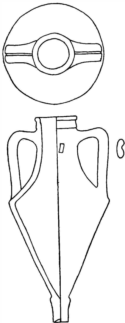
Fig. 2. — Tip de amforă de la Islam Geaferca (mărime 1/5).

Amforele din prima categorie au toate aceeași proporție în dimensionarea păr-