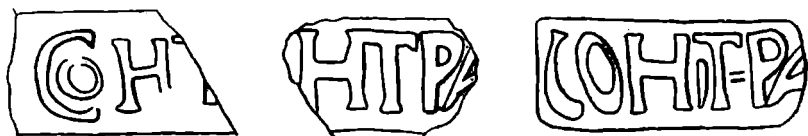
Fig. 5. Ștampile tegulare de la Acidava.

Pe un fragment de cărămidă, precum și pe altul de țiglă, ștampila se păstrează doar parțial; pe al treilea este întreagă (dimensiunile cartușului: 8,5 × 3,5 cm).