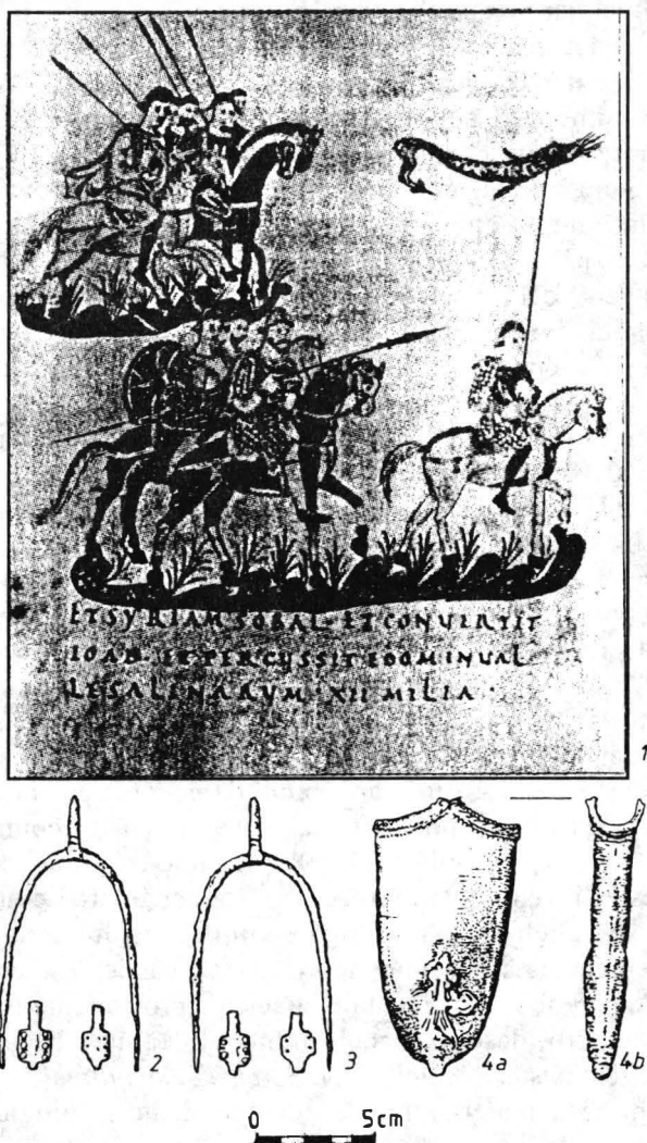
Fig. 2. 1 Reprezentarea unor războinici înarmați cu lănci cu aripioare (miniatură din sec. IX); 2-3 pinteni cu plăci de la Tărtăria; 4 buterolă de la Alba Iulia (2-4 Muzeul de Istorie Cluj-Napoca; după K. Horedt).

apusul și centrul european, din fostele teritorii ale statului franc merovingian și carolingian 11 , dar corespondențe aproape exacte cu piesa de la Alba Iulia întâlnim atât în spațiul nordic: în Finlanda, la Tampere sau Helsinki prevăzute cu mâner „tip L”-Petersen 12 , sau Norvegia, la Rimstadt, cu mâner „tip